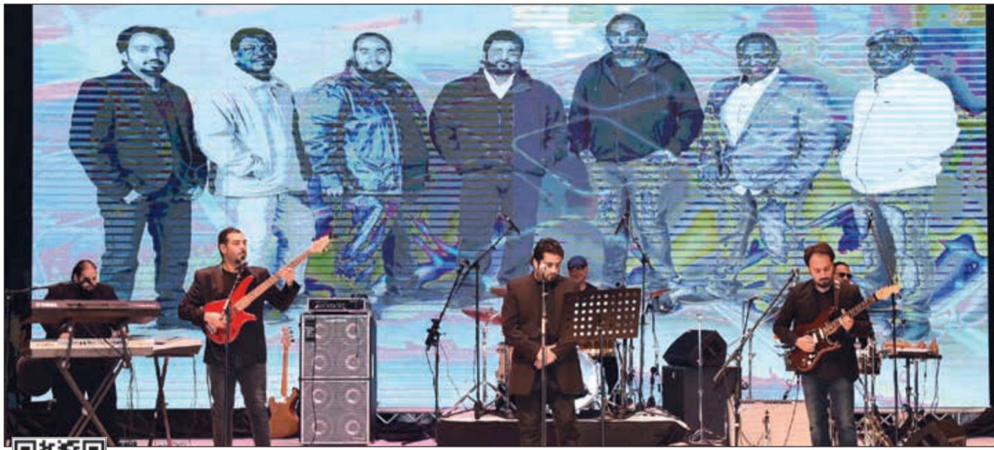
فرقة الأخوة البحرينية أثناء الحفل