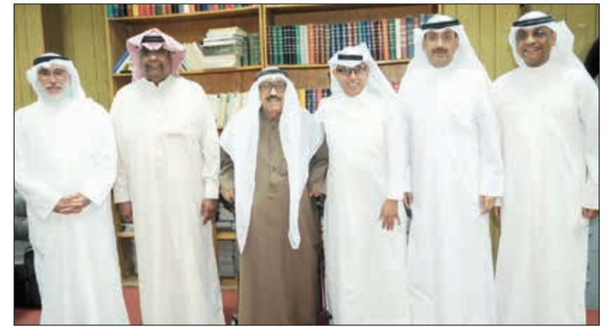
«شادي الخليج» متوسطا أعضاء مجلس الإدارة الجديد

ممثل خليجي يبحث عن أي وسيلة توصله إلى أحد المنتجين علشان يشارك في أعماله الدرامية والمصيبة كل الوسائل اللي اتبعها فشل.. تري غيره وايد!