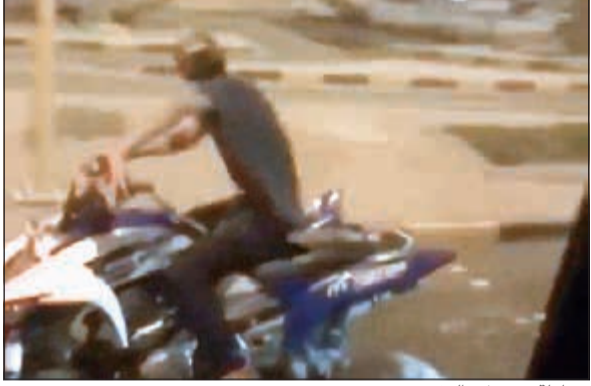
محاولة تشغيل «البقي»