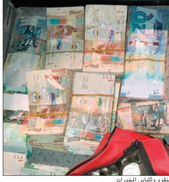
النقود واكياس المخدرات

هاني الظفيري أحمد خميس وجه وكيل وزارة الداخلية المساعد لشؤون الأمن العام اللواء إبراهيم الطراح بإحالة 7 أسويين إلى مباحث الأحمدية يوم أمس للوقوف على علاقتهم بمسروقات متنوعة ضبطت داخل حوطة هرولوا إليها، ومن المقرر أن تشمل التحقيقات أماكن سرقات تردد الوافدون عليها تمهيداً