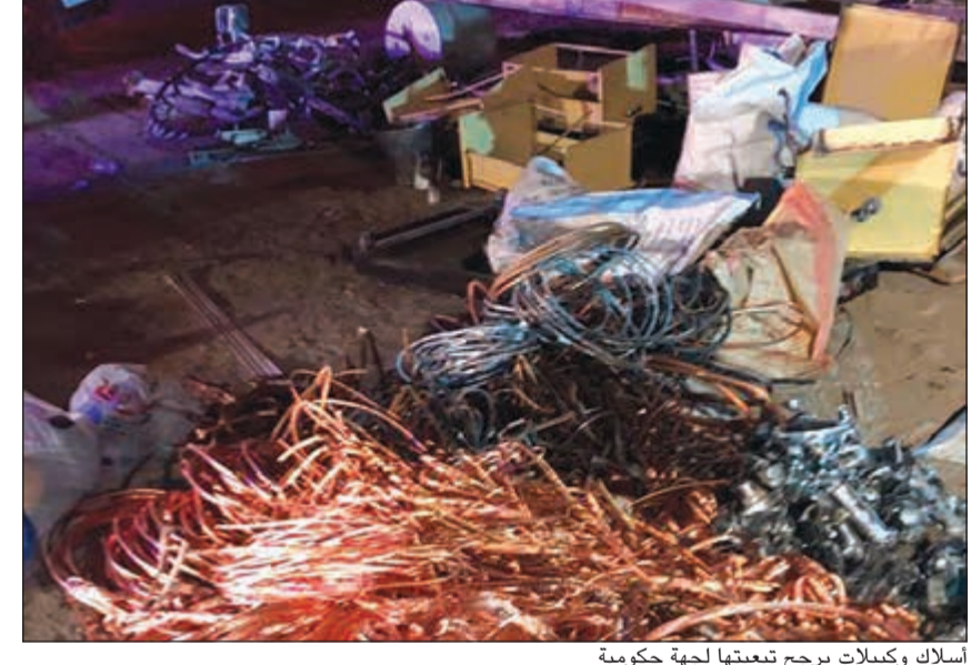
اسلاك وكيبيلات يرجح تبعتها لجهة حكومية