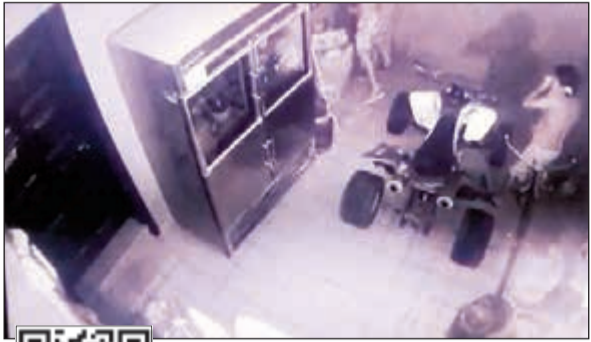
اللصوص الثلاثة خلال سرقة «البقي»

ومضى المصدر بالقول: انطلق المواطن المجني عليه في محيط المنطقة بحثاً عن البقي واللصوص وشاهدهم على مقربة من مستوصف المنطقة وهم يحاولون تشغيله، وما إن شاهد أحدهم المواطن وهو يقوم بتصويره حتى ترك البقي وهرب إلى