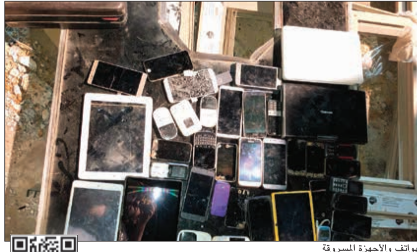
الهواتف والأجهزة المسروقة