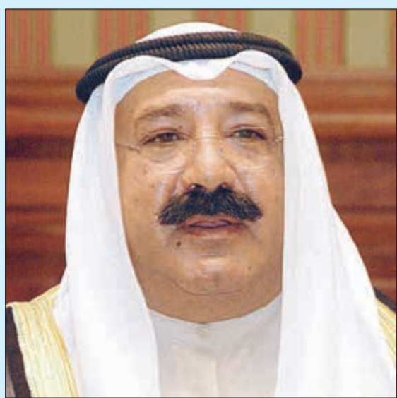
النائب الأول لرئيس مجلس الوزراء ووزير الدفاع الشيخ ناصر صباح الأحمد

«الأخبار» تهنيئاً الشيخ ناصر صباح الأحمد بنجاح العملية الجراحية: «أجر وعافية بوعبدالله»