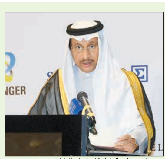
سمو رئيس مجلس الوزراء الشيخ جابر المبارك

اشتراط ديوان الخدمة المدنية على الراغبين في استكمال الدراسة العلمية الحصول على إجازة تفرغ دراسي و موافقة الديوان. وقالت مصادر مطلعة في تصريحات خاصة لـ «الأخبار» إن قرار الديوان يهدف إلى تحقيق أهداف عملية وحقيقية من الدراسة من خلال تمكين الراغبين في الدراسة من الانتظام في الدراسة فعلياً والاستفادة منها. وأضافت: نهدف أيضاً إلى قطع الطريق على كل الأساليب غير القانونية للحصول على شهادة دراسية من دون أي إضافة علمية. من جانبها، قالت مصادر نيابية إن سريان القرار على الموظفين الراغبين في استكمال الدراسة بعد ساعات الدوام الرسمي يحتاج إلى إعادة نظر. وكشفت عن أن مسؤولين في ديوان الخدمة المدنية