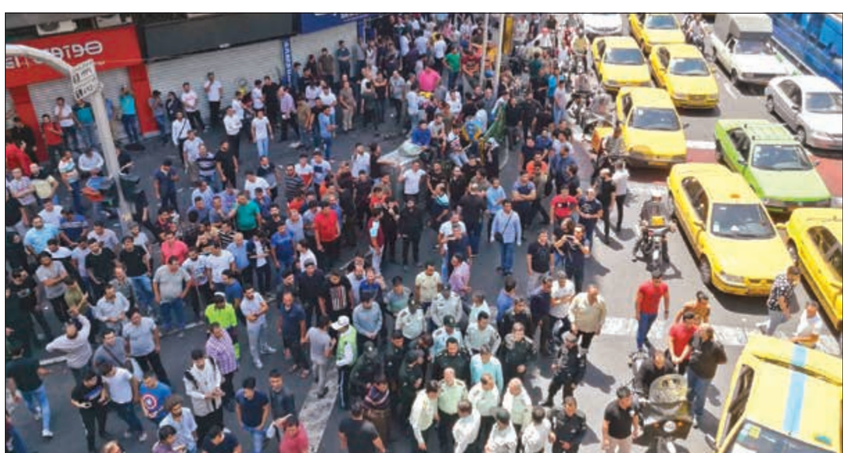
إيرانيون يحتجون على تدهور الوضع الاقتصادي في العاصمة بينما أضربت محلات «بازار طهران» أمس

طهران - وكالات: أضرب تجار «البازار» في طهران أمس في خطوة نادرة من نوعها احتجاجاً على التدهور المستمر في قيمة العملة الوطنية وتردّي الاقتصادي في البلاد، كما تظاهر عشرات التجار أمام مبنى البرلمان ونددوا بزيادة أسعار صرف العملات الأجنبية وغلاء المعيشة. وأعلن عشرات التجار الإيرانيين بمحافظة هرمزغان إضراباً عاماً دعماً للمتظاهرين بطهران. واندلعت مواجهات محدودة بين عشرات الشبان وقوات الامن في وسط العاصمة. وقد لعب «البازار» أي سوق طهران الكبير، دوراً بارزاً ومصيرياً في ثورة 1979 التي أسقطت آخر الشاه محمد رضا بهلوي. وبالتالي، انتشرت مقاطع فيديو على مواقع التواصل الاجتماعي تظهر على ما يبدو مواجهات أخرى بين محتجين وعناصر شرطة في طهران، وصرح رئيس المجلس المركزي لإدارة البازار عبدالله اصغندياري لوكالة «اسنا» الطلابية بأن