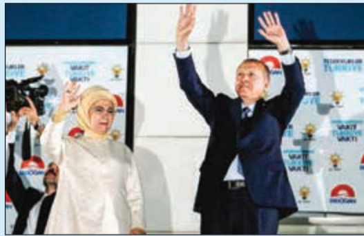
أردوغان وزوجته بيجيان بجياني مؤيديه عقب إعلان فوزه بانقرة أمس الأول

القدس - الأناضول: احتج نواب من اليمين الإسرائيلي المنطرف على تهنئة نواب عرب من داخل الكنيست للرئيس التركي رجب طيب أردوغان بإعادة انتخابه لولاية رئاسية ثانية. وقال العضو العربي في الكنيست طلب أبو عرار في قاعة الكنيست (البرلمان الإسرائيلي) «ألف مبارك فخامة الرئيس رجب طيب أردوغان على هذا الفوز العظيم رغم انوف الحاقدين، رغم من أرادوا لك الفضل فالحمد لله أولاً وأخيراً».