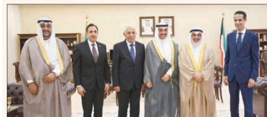
رئيس مجلس الأمة مرزوق الغانم متوسلاً رئيس ديوان المحاسبة بالإتابة عادل الصرعاوي يرافقه رئيس ديوان المحاسبة في الجمهورية اللبنانية القاضي احمد حمدان ورئيس الغرفة بالديوان القاضي عبدالرضا ناصر

● خالد الشطي: هيئة الغذاء، يجب أخذ الملاحظات الواردة في التقرير حتى تصير الأمور في تصابها الصحيح، ونقدم بالشكر الجزيل للفرق المختصة على هذه الهيئة وقامت بتوضيح اللوائح اللازمة للقيام بمهامها والواضح أن هناك عجزاً