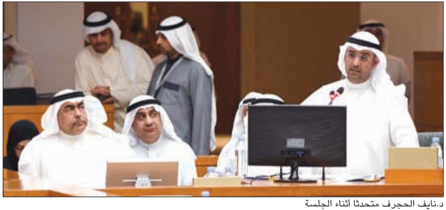
د.نايف الحجرف متحدثاً أثناء الجلسة

● وزير التجارة: التعديلات تمت بالتنسيق مع مقدمي الاقتراح، فبالنسبة للجمعية العمومية من 15 إلى 21 يوماً وخفض 25٪ إلى 10٪ لكي يطلبوا الجمعية العمومية، وعندما تقرر الجمعية توزيع الأرباح هناك مدة قانونية للتوزيع ووضعت لتكون خلال شهر. وهذه التعديلات من أفضل الممارسات الدولية الأخرى. ● صالح عاشور: لا توجد أي اقتراحات للشباب واستنوقت