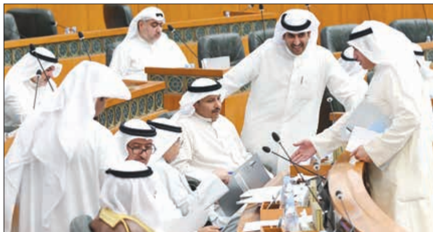
الشيخ خالد الجراح محاطاً بالنواب عسكر العنزي وفراج العريبي وطلال الجلال