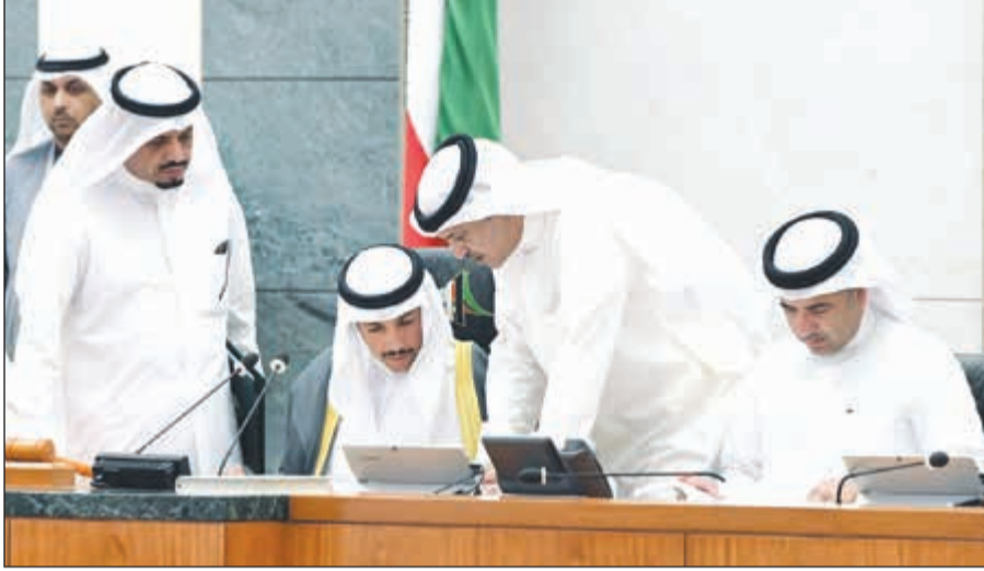
الرئيس مرزوق الغانم ونائبه عيسى الكندري وأمين السر دعدودة الرويعي وخالد العتيبي ومجد المطيري (ماني الشمري)

زيادة عدد الموظفين. صفاء الهاشم: يتعرض أو لا يتعرض الوزير كلامه غير صحيح وسيزيد عدد الموظفين ولن نقبل بذلك. والغريب هل يوجد وزير إعلام تتعنه «زراعة وسمج». مرزوق الغانم: سنصوت نداء بالاسم على القانون. الحضور 50، الموافقة 44، وعدم الموافقة 6، موافقة بالمداولة الأولى، ويتم التصويت الآن بمداولته الثانية، وفي المداولة الثانية الحضور 51، الموافق 45، وعدم الموافقة 6، موافقة على القانون ويحال إلى الحكومة. البنية التحتية انتقل المجلس إلى مناقشة تقرير اللجنة المالية والاقتصادية عن مشروع قانون بمساهمة دولة الكويت في رأسمال بنك الاستثمار الآسيوي للبنية التحتية.