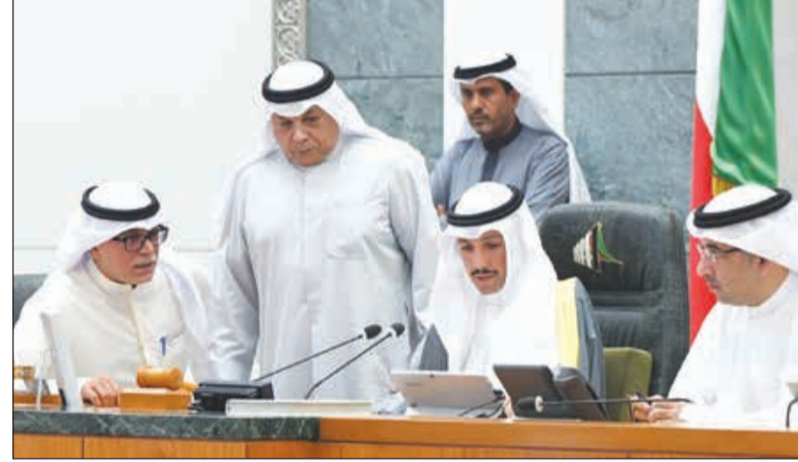
رئيس مجلس الأمة مرزوق الغانم والشيخ خالد الجراح وأمين السر دعدودة الرويعي وصالح خورشيد على المنصة

مناقشة في اللجنة. مرزوق الغانم: هل يوافق المجلس على التصويت؟ (موافقة عامة). وجرى التصويت نداء بالاسم على المداولة الأولى لقانون إصدار الشركات وكانت النتيجة كالتالي: الحضور 46، الموافقة 43، عدم الموافقة 3، امتناع 0. و جرى التصويت على المداولة الثانية وكانت النتيجة كالتالي: الحضور 46، موافقون 43، غير موافقين 3، امتناع 0. موافقة ويحال القانون للحكومة. ● صالح عاشور: نشكر المجلس على هذا القانون، ونذكر أن التعديلات مقدمة من مجموعة من النواب وهي تعديلات تصب في صالح عمل الشركات وصغار المستثمرين، فكل الشكر لمقدمي الاقتراح وأعضاء مجلس الأمة. ● مرزوق الغانم: شكراً والشكر موصول لأعضاء اللجنة المالية. وزارة الصحة، بدلاً من الكلفة المالية