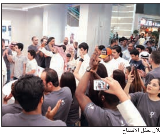
خلال حفل الافتتاح

الرؤى والأهداف الرامية نحو إثراء تجربة العملاء وتقديم ما يتناسب مع تطلعاتهم واهتماماتهم.