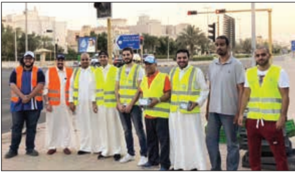
توزيع وجبات إفطار في التقاطعات المرورية