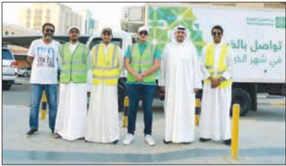
بعض أعضاء فريق «بيتك» التطوعي