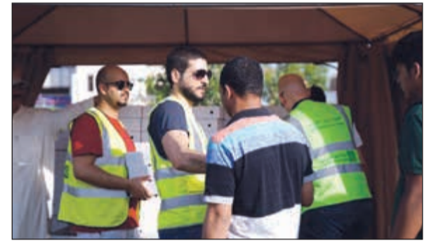
جانبا من توزيع وجبات الإفطار

بذل جهودا جبارة في اللبالي العشر الأواخر من رمضان لخدمة المصلين ومساعدة رجال الدفاع المدني والأمن المتواجدين، والمشاركة في التنظيم في مساجد سعد بن أبي وقاص في منطقة كنفان، ومسجد الراشد في منطقة السلام، ومسجد الدولة الكبير.