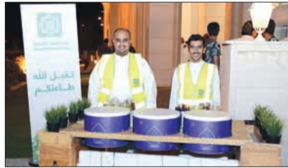
خدمة الضيافة للمصلين