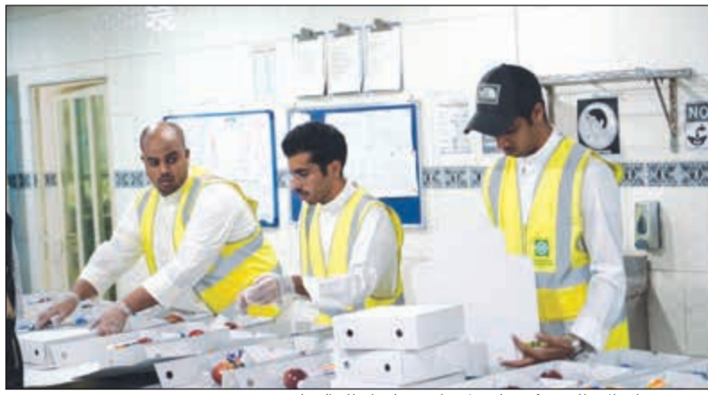
تجهيز وجبات الإفطار بمركز خاص لإعداد وجبات إفطار الصائم