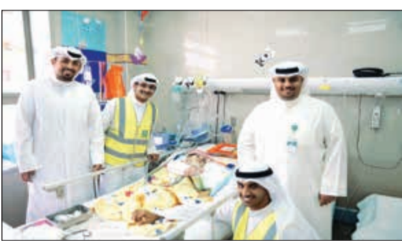
عيادي للأطفال نزلاء المستشفيات

وقال ان «بيتك» تميز بمبادراته في تقديم خدمة الضيافة في صلاة التراويح بعدد من المساجد، والمساهمة في جهود تنظيم صلاة القيام بالعشرة الأواخر بالإضافة إلى خدمة الضيافة، ضمن إطار الحرص على التواصل مع المجتمع في مختلف المناسبات، مشيراً إلى أن فريق «بيتك» التطوعي