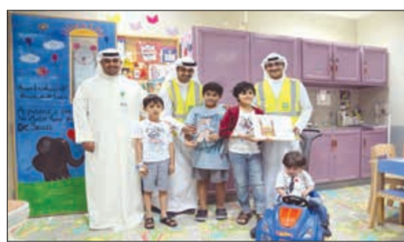
جانبا من القرقيعان

تشمل توزيع وجبات إفطار الصائم، وخدمة ضيافة المصلين في التراويح والعشر الأواخر، وتوزيع القرقيعان وزيارة المستشفيات ودور الرعاية، وغيرها الكثير من المبادرات التي لاقت ترحيبا واستحسانا كبيرين من المجتمع. وأوضح الرويح أن فريق «بيتك» التطوعي قام بتوزيع أكثر من 27 ألف وجبة إفطار صائم على مدار الشهر الكريم في مواقع مختلفة شملت عدة مواقع في محافظات العاصمة وحولي والفروانية بما فيها مواقع ثابتة