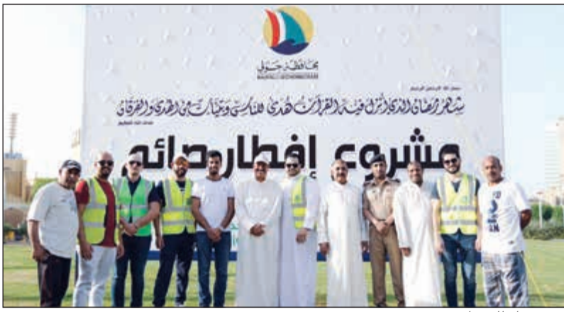
مشروع إفطار صائم