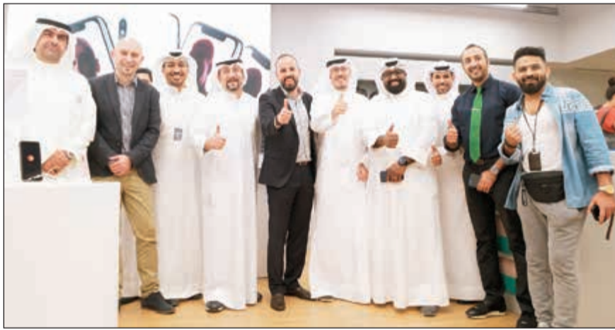
صورة جماعية لفريق العمل

ذلك، أكدت Ooredoo الكويت فخرها واعتزازها بالتعاون مع Gait في هذا العرض الحصري والمميز، مشيدة باتساق