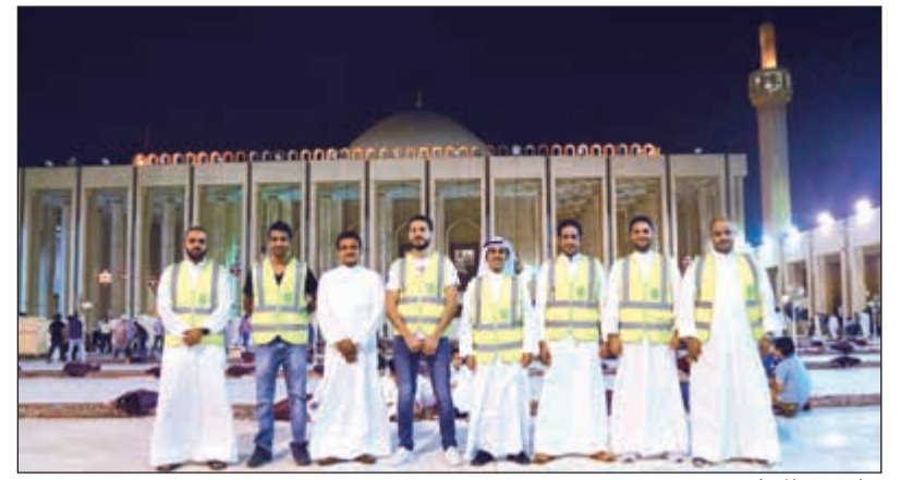
تواجد في المساجد

أكثر من 90 مبادرة في 29 يوماً.. تركت بصمة واضحة في المجتمع