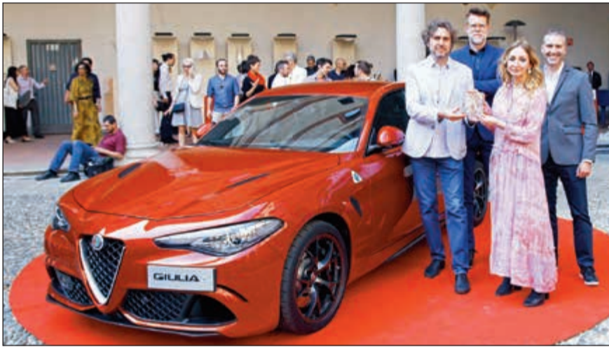
فريق التصميم مع جائزة كومباسو دي أورو آدي، للتصميم العالمي

تم تركيبها في جسم مدمج. وهذه النسب ترسم الشكل الديناميكي للسيارة. والملح الثاني من الأناقة الإيطالية هو البساطة، والقدرة على تغطية ما هو في الواقع واحدة من العمليات الإبداعية الأكثر تعقيدا في الصناعة ألا وهو تصميم سيارة. والأمر متروك للأسلوب لإخفاء العمل الطويل والمعقد وراء خط بسيط وطبيعي يعزز الأشكال الأنيقة والذوق الإيطالي المتطور. ولطالما تم التعبير عن تصميم ألفا روميو من خلال خطوط نظيفة مرسومة باليد، وممزوجة بسلاسة بأسطح نقية منحوتة يدويا. والعنصر الأساسي الذي استلهم تصميم جوليا الجديدة هو السائق. وترتكز مقصورة السيارة على إرضاء أجواء القيادة بطريقة نظيفة وأساسية حيث يمكن رؤية وجود التكنولوجيا بشكل واضح بين الأدوات التي تحيط بالسائق.