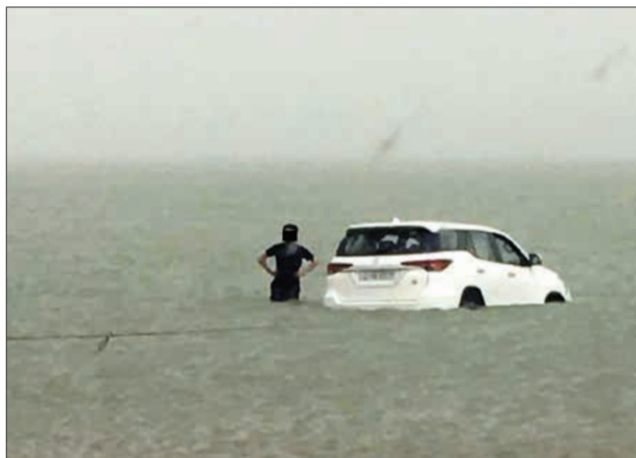
المركبة الرباعية وتبدو المياه تحيط بها من كل جانب

إلى عمليات الداخلية من رب أسرة كويتي أفاد فيه بغرق سيارته داخل البحر وعلى الفور تم توجيه الدوريات والاطفاء وتم اخراج السيارة، وانقاذ من بداخلها وتم تسجيل اثبات حالة في مخفر شرطة الجهراء.