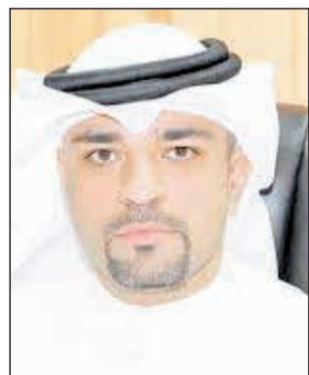
المستشار محمد الدعيج

مقيم صدرت قبل 5 سنوات وأكثر أوامر وأحكام نهائية بإبعادهم عن البلاد إلا أنهم يصلون ويجولون فيها دون أن يغادروها أو حتى أن يقدموا التماسا وفق الإجراءات المنظمة. طيلة هذه السنوات، وأضاف المصدر أن المستشار الدعيج أوصى بضرورة سرعة ضبط هؤلاء وإحالتهم إلى إدارة الإبعاد تمهيدا لترحيلهم من البلاد تطبيقا للقانون نظرا لارتكابهم جرائم مختلفة، مبشيرا إلى أن هذا الإجراء يأتي ضمن الحلول التي تراها اللجنة لقضية المبعدين وفقا لمصلحة البلاد.