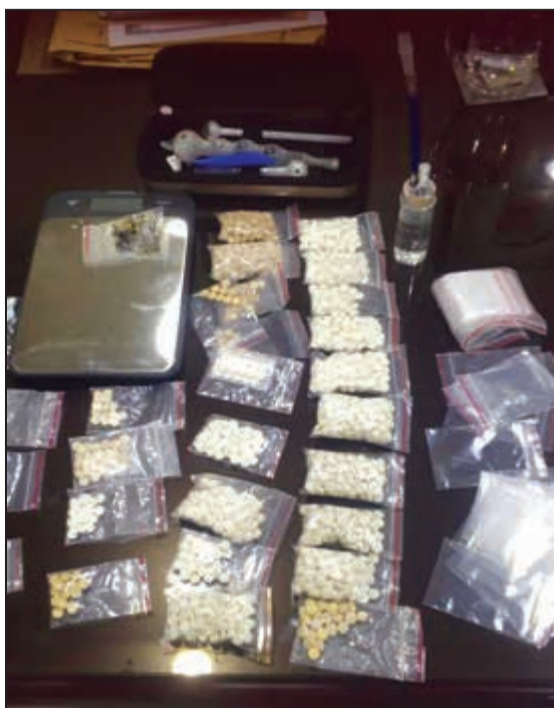
المضبوطات التي تم العثور عليها في منزل مواطن بمنطقة سعد العبدالله

علمت «الأنباء» أن الأجهزة الأمنية أصدرت أوامر بضبط وإحضار 200 مقيم على الأقل من جنسيات مختلفة صادر ضدهم عدة أوامر إدارية وأحكام قضائية بالإبعاد عن البلاد قبل سنوات ولم ينفذوها حتى الآن. وكشف مصدر أن رئيس اللجنة المختصة بإجراء دراسة شاملة بجميع حالات منتظري الإبعاد الموقوفين بإدارة الإبعاد المستشار محمد الدعيج، وبعدها طلب من إدارة الإبعاد كشفا بشأن من تقرر إبعادهم تبين أن من بينهم 200