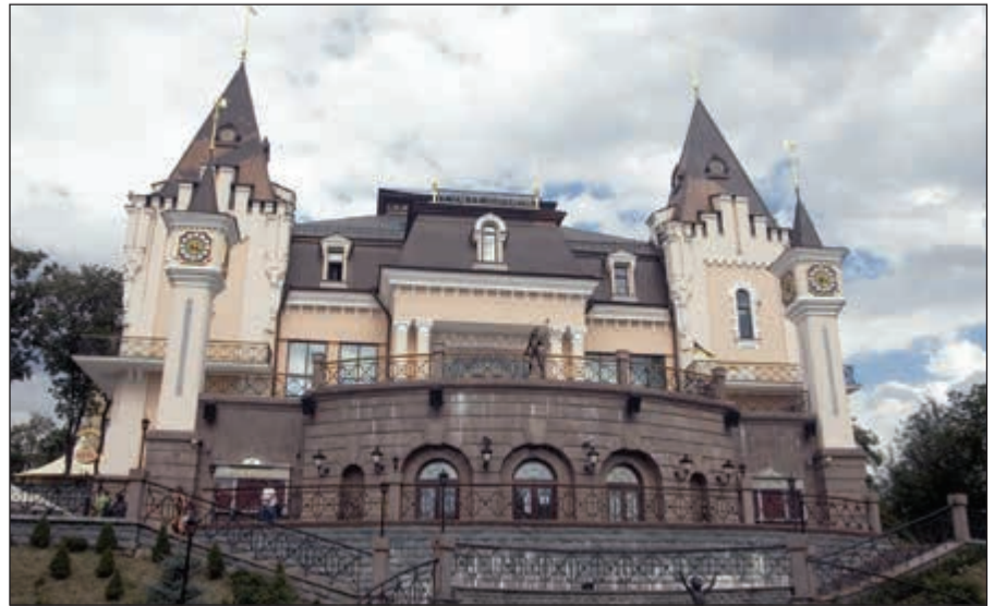
مسرح العرائس إبداع في

معارض مشتركة وماذا عن جهود السفارة الأوكرانية في الكوييت لتنمية العلاقات الثنائية؟ ● تنتفع لتنظيم بعض