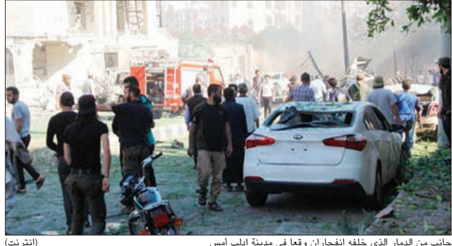
جانب من الدمار الذي خلفه انفجاران وقعا في مدينة إلب أس

عواصم - وكالات: بدأت تداعيات تصعيد النظام السوري العسكري بالظهور على شكل حركة نزوح جماعي هو الأكبر منذ توقيع «اتفاق خفض التصعيد» في الجنوب الذي توصلت إليه الولايات المتحدة وروسيا والأردن في يوليو الماضي.