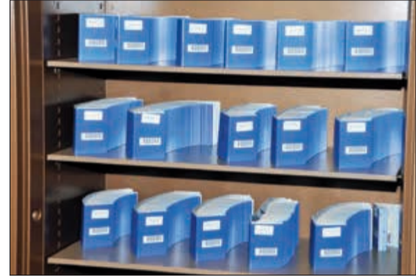
فترة إنجاز الجوازات الجديدة لا تتجاوز 10 أيام