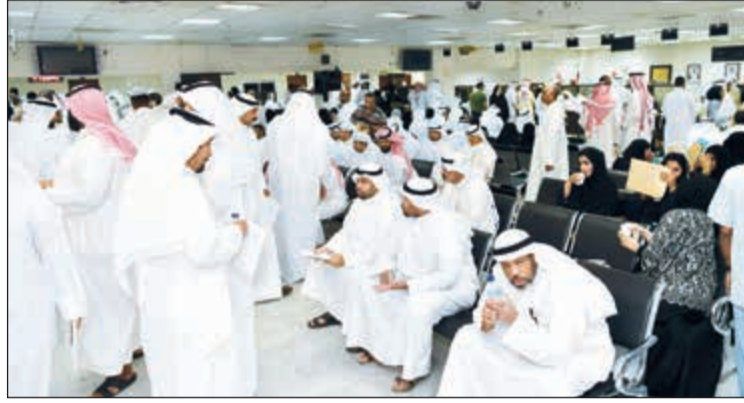
الازدحام جاري التعامل معه باستحداث فترة عمل ثالثة