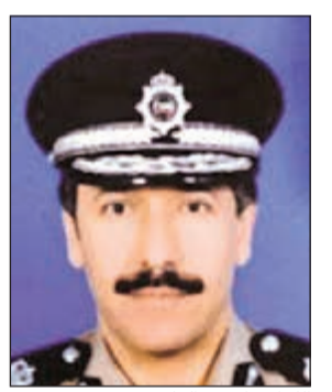
اللواء عابدين العابدين