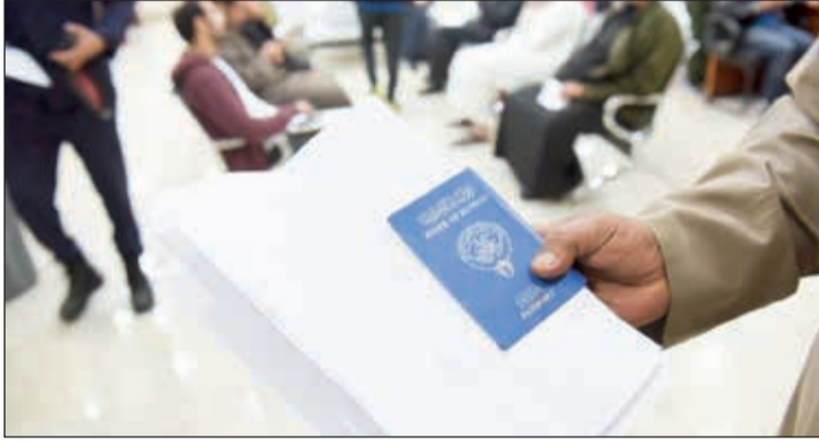
المطلوبون لا تصدر لهم جوازات سفر