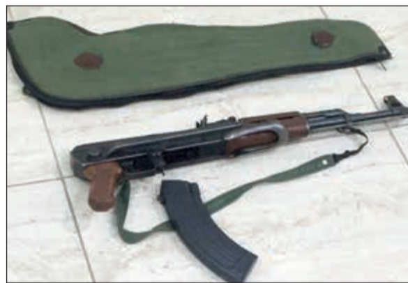
السلاح المضبوط احيل للنيابة