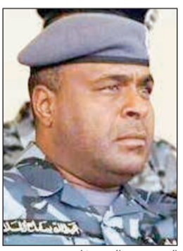
العميد عبدالله سفاح

وجه مدير عام أمن الفروانية اللواء صالح مطر بإحالة وافد أردني إلى الإدارة العامة لمكافحة المخدرات على خلفية حيازة كميات كبيرة من المواد المخدرة المتنوعة وأرق في ملف الإحالة حبوبا وشبو وحشيشا وكيميكا وهيروين وأدوات تعاط وأدوات تستعمل في تجربة المخدرات وحصيلة بيع، واستنادا إلى مصدر أمني، فإن إحدى دوريات إسناد الفروانية وخلال قيامها بجولة تفتيش في نطاق المحافظة اشتبهت في مركبة بقيادة شخص تبين أنه وافد أردني، وتبين لرجال الإسناد أنه في حالة غير طبيعية، وعليه تم تفتيشه احترازا ليعثر رجال الأمن على المخدرات، هذا، وأقر الوافد الأردني بأنه امتن تجارة المواد المخدرة بأنواعها قبل سنوات، وأنه معروف في أوساط المتعاطين بتجاره في السموم المخدرة ويعرف بإمبراطور المخدرات، من جهة أخرى، أمر مدير أمن محافظة حولي اللواء عابدين العابدين بإبعاد وأقدين أسويين بعد ضبطهما في حالة سكر بالإضافة إلى قيامهما بإطلاق راحة السكان. وكان اللواء العابدين قد تلقى شكوى عديدة من سكان منطقة حولي بشأن أسويين يحتسيان المواد المسكرة، ثم يقومان بإفلاق من شأنها إفلاق راحة السكان، فتم توجيه دورية أمنية إلى موقع البلاغ، وتمكن رجال الأمن من توقيف الأسويين واقتيادهما إلى المخفر تمهيدا لإبعادهما. من جهة أخرى التي رجال أمن حولي القبض على وافد عربي صادر بحق أمر ضبط واحضار من قبل البحث والتحري بمباحث شؤون الإقامة، ونكر مصدر أمني أن الوافد مشتبته بتورطه في تزوير محررات رسمية. كذلك تمكن رجال أمن حولي من ضبط 9 أشخاص، بينهم 4 مواطنين والباقي وأقربون بعد أن تبين أن أوامر القاء قبض صادرة بحقهم، كذلك التي القبض على شخصين غير كويتيين وتبين أنهما مطلوبان القاء قبض على ذمة قضايا اعتداء.