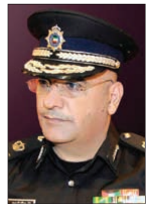
اللواء خالد الدينين

مباحث السلاح بالتواصل مع النيابة العامة والتي منحت الإذن بضبط المتهم وتفتيش مسكنه لتنتقل قوة من المباحث وتضبط المواطن