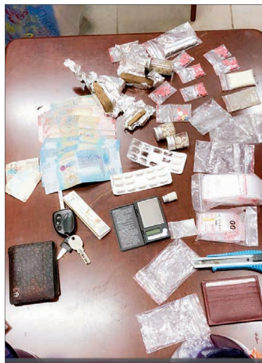
المخدرات المضبوطة مع الوافد الأردني