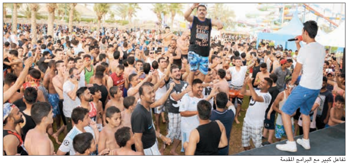
تفاعل كبير مع البرامج المقدمة

احتفلت المدينة المائية «أكوابارك» بمناسبة العيد المبارك تحت شعار «تعليمية وثقافية وترفيهية واجتماعية»، وقد شارك في المهرجان جموع المواطنين والمقيمين ابتهاجا بالعيد، حيث قدمت المدينة العديد من الفقرات المتنوعة للكنار والصغار وخاصة الأطفال ذوي