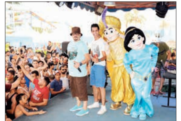
حشد كبير على بوابة الأكوابارك