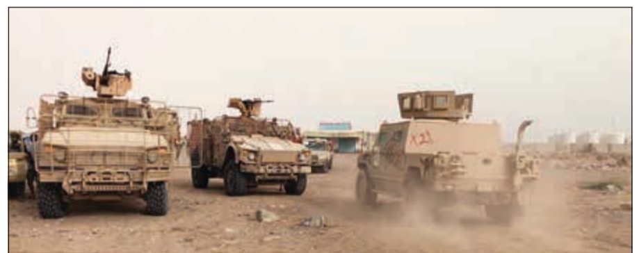
مدرعات لقوات الشرعية خلال المواجهات مع الميليشيات الحوثية في مطار الحديدة أمس الاول

للدفع نحو الحل السياسي الشرعية اليمنية تفتح معارك في جميع الجبهات