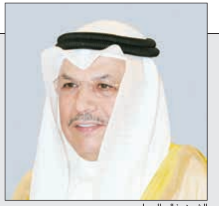
الشيخ خالد الجراح

الخليفة لـ «الأنباء»: جهد كبير للارتقاء بالخدمات المقدمة لذوي الاحتياجات الخاصة 05