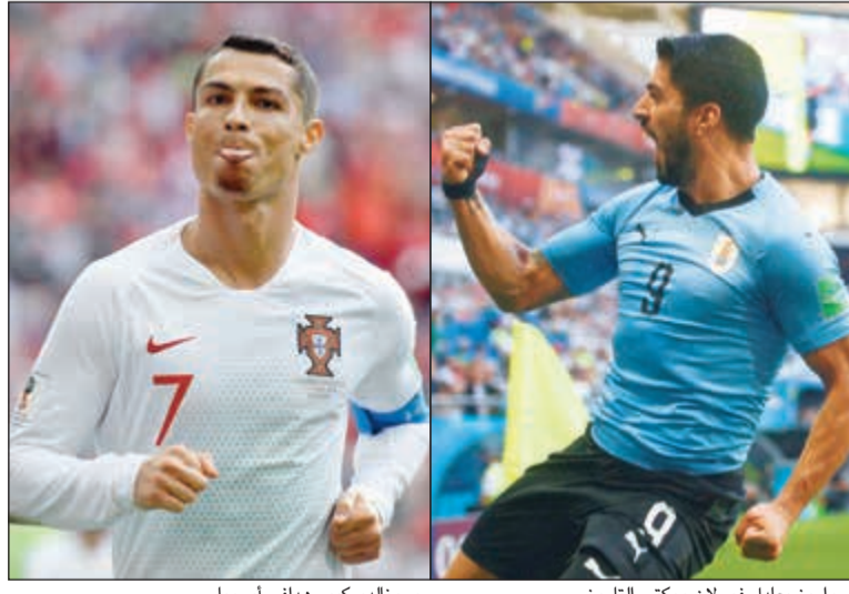
سواريز يعادل فورلان ويكتب التاريخ.. ورونالدو كبير هدافي أوروبا

خروج مشرف لـ «أسود الأطلس» ورونالدو كبير هدافي أوروبا بالمونديال