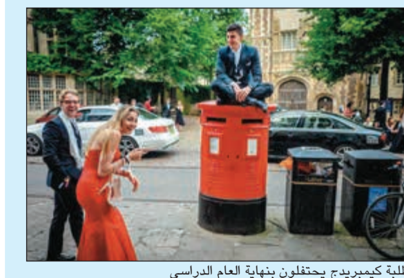
طلبة كيمبريدج يحتفلون بنهاية العام الدراسي

احتفل طلاب جامعة كيمبريدج البريطانية بنهاية العام الدراسي بالأسلوب التقليدي وهو السهر حتى ساعات الصباح ثم التجول في أزقة المدينة التاريخية بملايس السهرة. وكما هو متوقع لم يكن جميع الطلاب والطالبات بحالة من الوفاق التي تنتظر من مفكر وساسة المستقبل في بلادهم، فالجامعة اشتهرت تاريخيا بأنها مصنع لشخصيات مستقبل من علماء ومفكرين سياسيين ليس من بريطانيا فحسب بل من بلدان كثيرة في العالم. ولكن أجواء المرح والدعابة الرصينة كانت سائدة هذه المرة، فالطلاب تقيدوا بسترات السهرة المعتادة وبربطات العنق في حين التزمت معظم الطالبات بفساتين السهرة الطويلة، هذا كله لم يحل دون نزول البعض بكامل أناقتهن وأناقتهن الى المياه المنعشة ببرودتها لنهر البلدة الأمر الذي ساعد على إزالة بعض آثار الكحول الذي استهلكه بحرية طوال الليل.