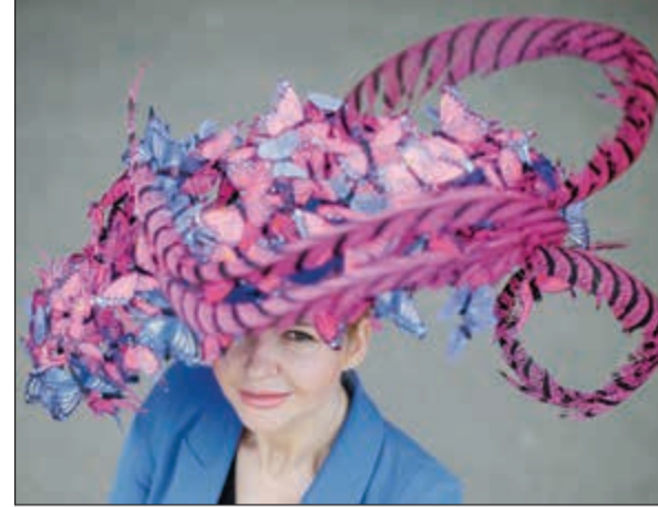
القبعة محط الانظار

والمن الطبيعي ان الانظار كانت مشدودة هذا العام ليس الى العربية الملكية فقط بل ايضا من تقاليدنا الثابتة واحدا من تقاليدنا الثابتة دخول ملكة بريطانيا الى ميدان السباق في عربتها الملكية تعقبها عربات اخرى تقل أفرادا من العائلة المالكة.