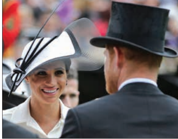
ميغان ماركل.. إضافة جديدة للعائلة المالكة