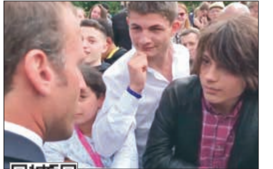
الرئيس ماكرون وميخا الصبي