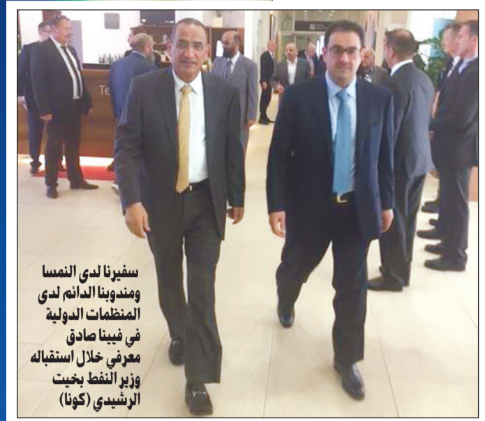
سفيرنا لدى النمسا ومندوبنا الدائم لدى المنظمات الدولية في فيينا صادق معرفي خلال استقباله وزير النفط بخت الرشيدي

قال وزير النفط بخت الرشيدي أمس: إن دول منظمة (أوبك) والدول الأخرى المنتجة للنفط ستتخذ القرار المناسب للحفاظ على استقرار السوق النفطية في اجتماعها الجمعة المقبل.