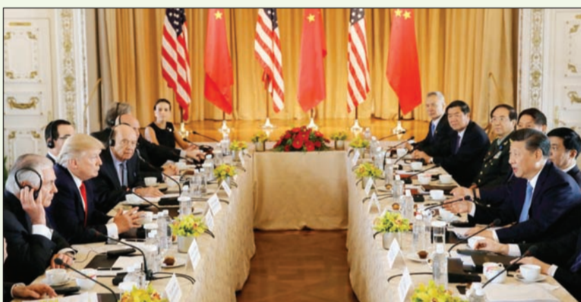
لقطة أرشيفية لمحادثة أميركية - صينية في فلوريدا

جمركية على المنتجات الأميركية. وتجه واشنطن وبكين فيما يبدو نحو صراع تجاري مفتوح بعدما فشلت المفاوضات في التغلب على الشكاوى الأميركية بشأن السياسات الصناعية الصينية وعدم الوصول إلى السوق الصينية وعجز تجاري أميركي قيمته 375 مليار دولار.