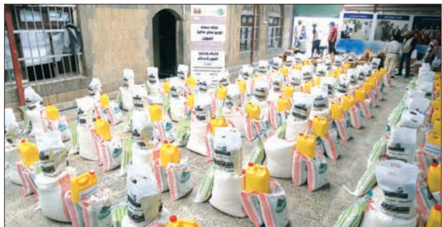
جانب من توزيع المساعدات

التي تقع تحت خط الفقر والأسر النازحة وأصحاب الهمم (ذوي الإعاقة) وأوضح أن السلة التموينية تتضمن الأنواع الأساسية من أصناف الطعام التي تحتاجها الأسر كالأرز والذرة والقمح والسكر والحليب المجفف والقمح المطحون، والتي ستعد مساهمة حقيقية في التخفيف من الأعباء التي تتحملها الأسر في هذه الظروف الصعبة.