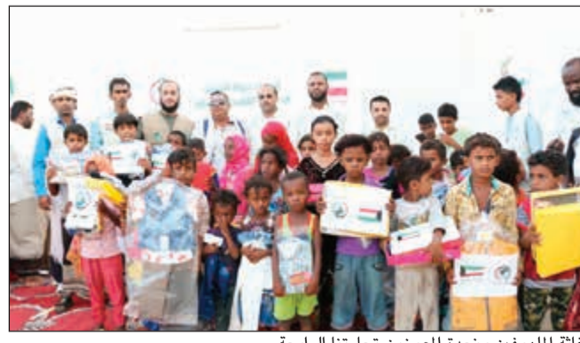
إغاثة المهنيين ونجدة المعوزين تجارتنا الراحلة