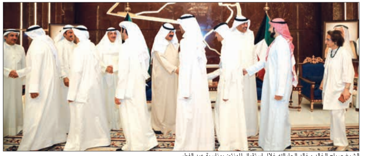
الشيخ صباح الخالد وخالد الجارالله خلال استقبال المهنيين بمناسبة عيد الفطر

وبعث سمو ولي العهد الشيخ نواف الأحمد ببرقية تعزية إلى جلالته الإمبراطور أكهيتو إمبراطور اليابان الصديقة ضمنها سموه خالص تعازيه وصادق مواساته لجلالته ولأسر الضحايا الذين ضربت منطقة أوساكا والذي أسفر عن سقوط عدد من الضحايا ومئات المصابين، راجيا سموه وللضحايا الرحمة وللصالحين سرعة الشفاء والعافية وبيان يتمكن المسؤولون في البلد الصديق من تجاوز آثار هذه الكارثة الطبيعية.