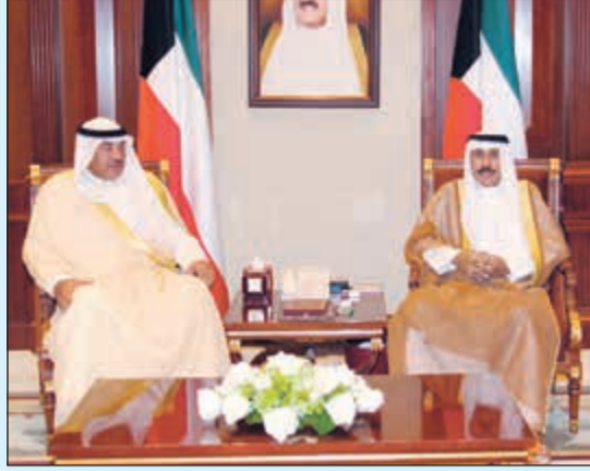
سمو ولي العهد الشيخ نواف الأحمد مستقبلا الشيخ صباح الخالد