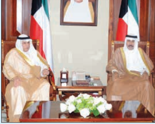
سمو ولي العهد الشيخ نواف الأحمد مستقبلا الشيخ خالد الجراح