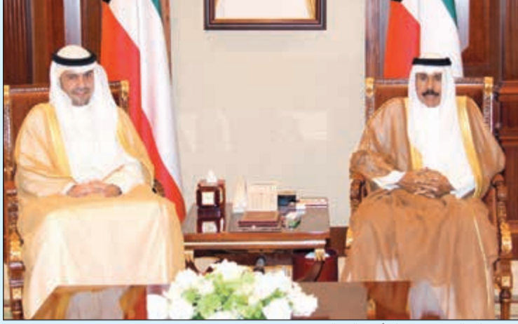
سمو ولي العهد مستقبلا أنس الصالح

استقبل سمو ولي العهد الشيخ نواف الأحمد بقصر بيان صباح أمس سمو رئيس مجلس الوزراء الشيخ جابر المبارك . كما استقبل سمو ولي العهد الشيخ نواف الأحمد بقصر بيان صباح أمس نائب رئيس مجلس الوزراء وزير الخارجية الشيخ صباح الخالد. كما استقبل سمو ولي العهد بقصر بيان صباح أمس نائب رئيس مجلس الوزراء وزير الداخلية وزير الدفاع بالإنابة الشيخ خالد الجراح. واستقبل سمو ولي العهد نائب رئيس مجلس الوزراء وزير الدولة لشؤون مجلس الوزراء أنس الصالح.