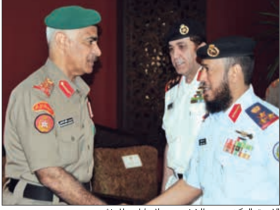
الفريق الركن محمد الخضمر مصافحا أحد المهنيين