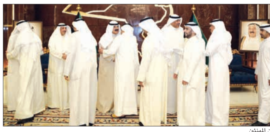
جانب من المهنيين