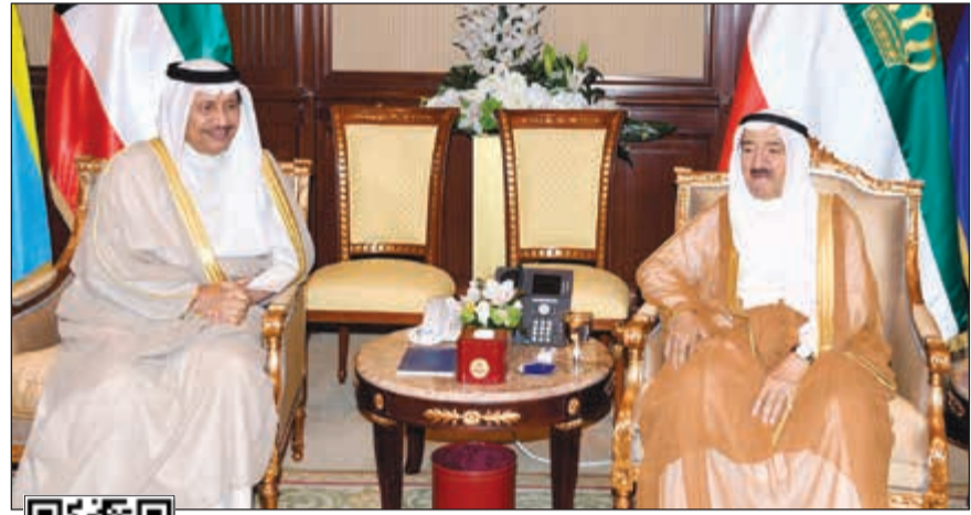
صاحب السمو الأمير الشيخ صباح الأحمد خلال استقبال سمو رئيس مجلس الوزراء الشيخ جابر المبارك

استقبل سمو ولي العهد الشيخ نواف الأحمد بقصر بيان صباح أمس سمو رئيس مجلس الوزراء الشيخ جابر المبارك . كما استقبل سمو ولي العهد الشيخ نواف الأحمد بقصر بيان صباح أمس نائب رئيس مجلس الوزراء وزير الخارجية الشيخ صباح الخالد. كما استقبل سمو ولي العهد بقصر بيان صباح أمس نائب رئيس مجلس الوزراء وزير الداخلية وزير الدفاع بالإنابة الشيخ خالد الجراح. واستقبل سمو ولي العهد نائب رئيس مجلس الوزراء وزير الدولة لشؤون مجلس الوزراء أنس الصالح.