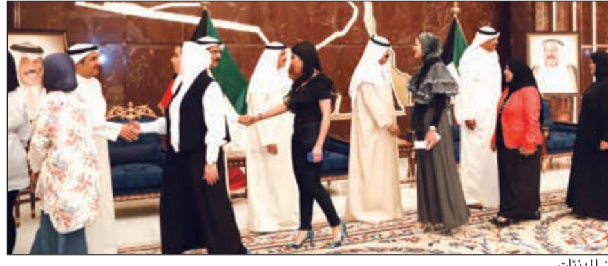
جانب من المهنيات