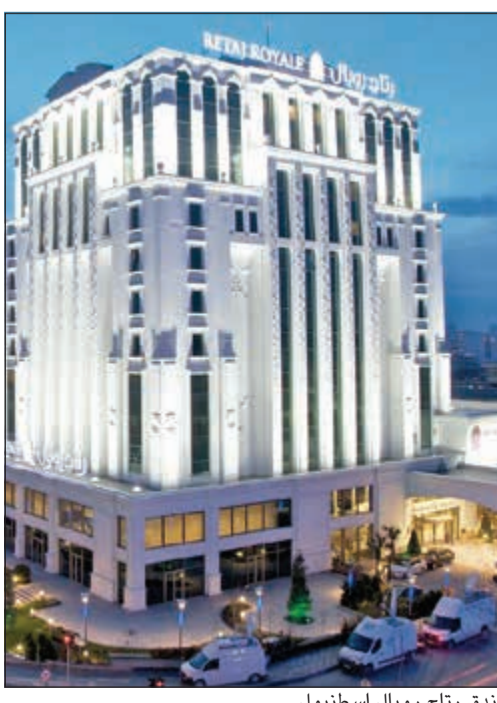
فندق رتاج رويال إسطنبول

فندق رتاج رويال اسطنبول Retaj royal Istanbul الوجهة الأمثل للعائلات المحافظة، فلحظة دخولك إليه يستقبلك طاقم يتكلم اللغات العربية والانجليزية والتركية، يوفر لك غرفا تستعمل على خدمات راقية وحمام من الرخام مزود بحوض استحمام، وسط ديكور عصري، وتلفزيون ال اي دي لتابعة القنوات الفضائية المتنوعة وعلى رأسها القنوات العربية. فعلى بعد 7 كم فقط من مطار أتاتورك الدولي وسي إن آر إكسبو سنتر يقع رتاج رويال اسطنبول، الذي ستجد فيه كل ما تحتاج إليه من حمام السباحة الخاص بالرجال وحمام خاص بالنساء، ومسبح داخلي، ومركز لياقة بدنية وحمام تقليدي، كما يوفر مركز السبا مجموعة واسعة من العلاجات الخاصة بالاسترخاء والجمال.