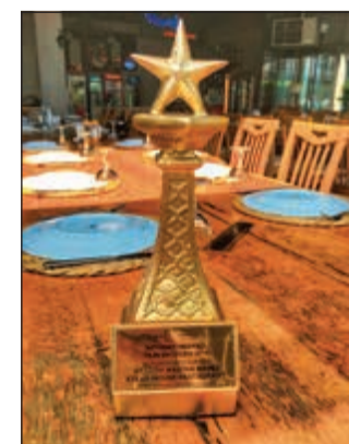
دع لمطعم ناملي ستيك هاوس