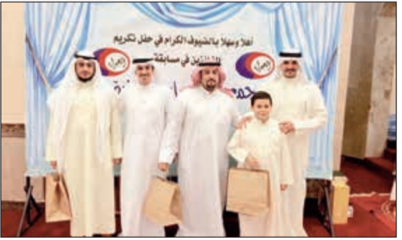
تكريم أحد الفائزين