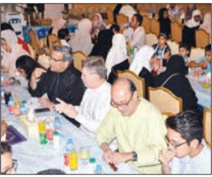
إفطار صائم للجاليات الغربية