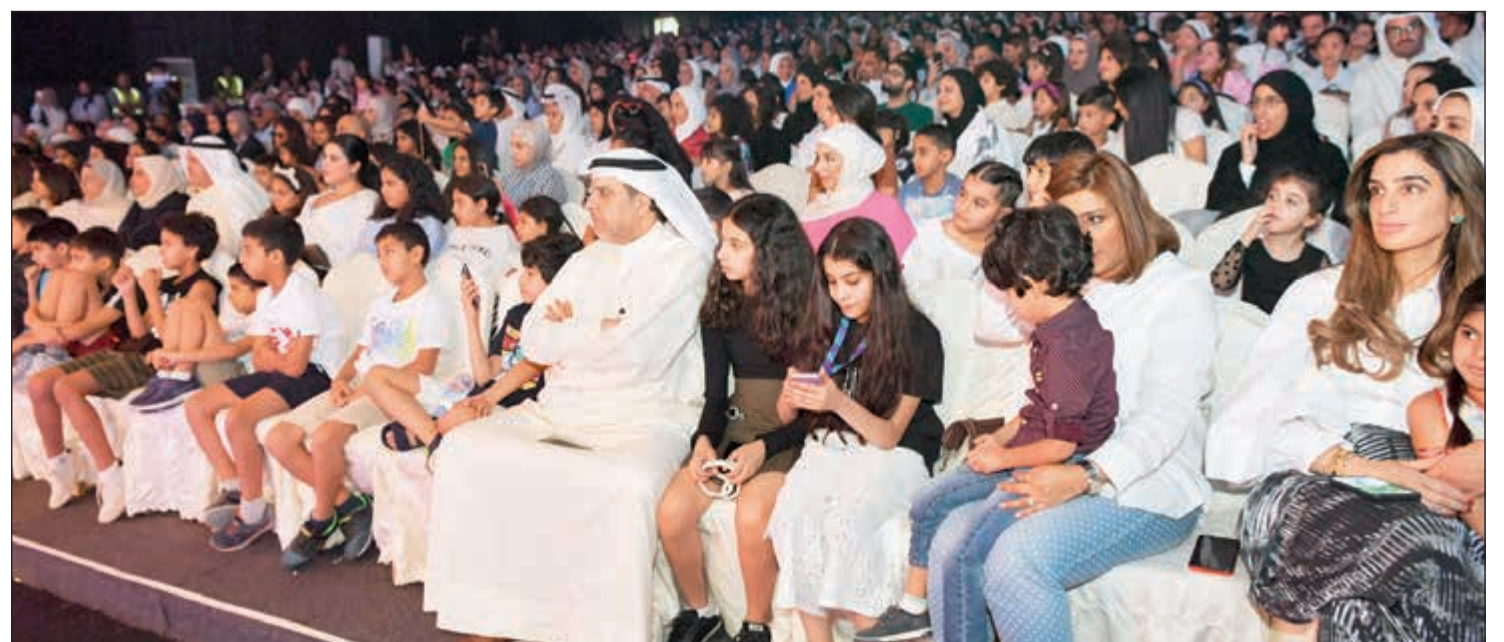
جمهور حاشد من أهل الصحافة وعملاء «زين»