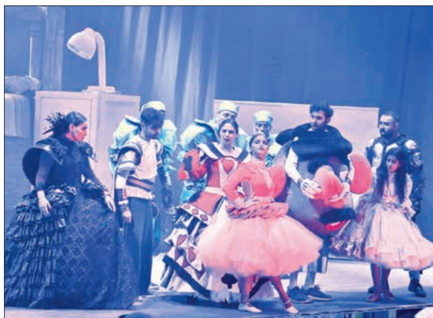
لوحة استعراضية مبهرة

الألحان التي صاغها بشار الشطي ووزعها ربيع الصيداوي تفاعل معها الأطفال بشكل لا يوصف