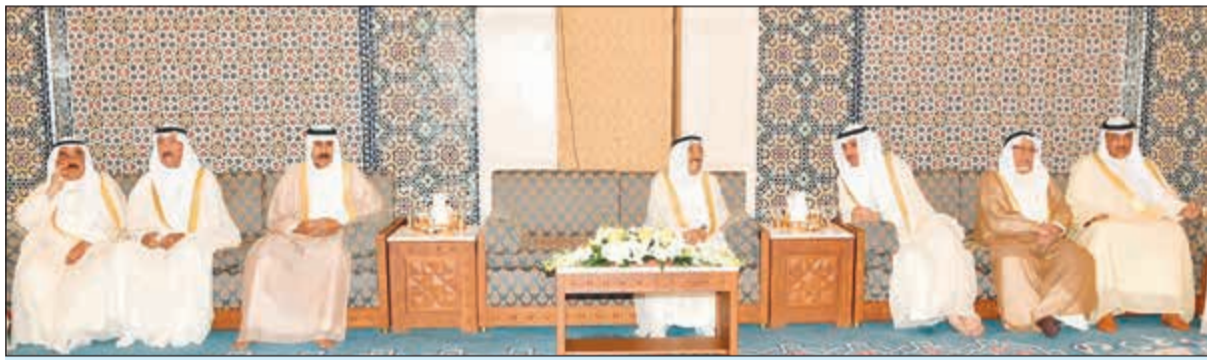
صاحب السمو الأمير الشيخ صباح الأحمد وسمو ولي العهد الشيخ نواف الأحمد ورئيس مجلس الأمة مرزوق الغانم والشيخ جابر العبدالله والشيخ فيصل السعود والشيخ علي الجراح والشيخ صباح الخالد

علمت «الأبناء» انه تم تكليف ديوان الخدمة المدنية بتنفيذ الأحكام القضائية الصادرة من المحكمة الإدارية بإلغاء قرارات الحكومة بإحالة بعض القياديين إلى التقاعد. وقالت مصادر مطلعة في تصريحات خاصة لـ «الأبناء» ان التعليمات الحكومية الصادرة إلى ديوان الخدمة المدنية نصت على تنفيذ الأحكام وإعادة القياديين المشمولين بها إلى أعمالهم. وأضافت ان تنفيذ الأحكام يتم بالمسميات نفسها التي كان القياديون يحملونها قبل الإحالة إلى التقاعد، وإصدار تعليمات بصرف الرواتب ذاتها، مع ملاحظة ان الإعادة إلى العمل ستتم من دون إسناد الصلاحيات التي كانوا يتمتعون بها قبل الإحالة إلى التقاعد والتي كلف بها قياديون آخرون. وأشارت المصادر إلى ان تنفيذ الأحكام يتم بعد نفاذ آخر درجة للتقاضى تدافع خلالها الحكومة عن قراراتها وإذا خسرتها فإنها لا تتوانى في تنفيذ الحكم.