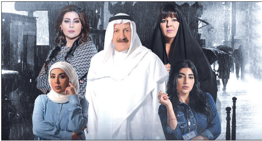
مسلسل «محطة انتظار»

بعد أن رصدنا آراء النقاد في مسلسلات رمضان من النواحي الفنية من خلال جائزة «شعلة الأنباء» السنوية الأسبوع الماضي، أجرينا استبيان «الأنباء» الرمضاني على عينة عشوائية من 500 مشترك في مختلف محافظات البلاد. وأظهرت نتائج الاستبيان الجماهيري توزعاً كبيراً للأصوات على خلاف المواسم الماضية وينسب متقاربة جداً بين 8 مسلسلات تراوحت بين 12 و8% مع تقدم بسيط لمسلسل «عبرة شارع» الذي احتل الصدارة، يليه مباشرة «الخطايا العشر»، ثم «مع حصّة قلم» و«محطة انتظار» و«الخافي أعظم» و«روتين» و«عطر الروح» و«العاصوف». وقراءة هذه النتائج تدل على أن معظم الأعمال قد حظيت بالمشاهدة هذا الموسم واستقطبت الجمهور من جميع الفئات، ولا يمكن الحديث عن اكتساح أي منها أو استئثار مسلسلين بالغالبية وانقسام المنافسة الجماهيرية بينهما كما كان يحصل في المواسم السابقة.