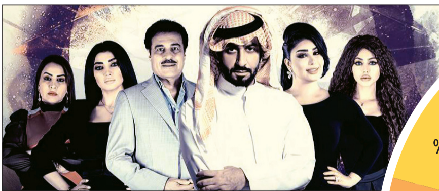
مسلسل «التاسع من فبراير»