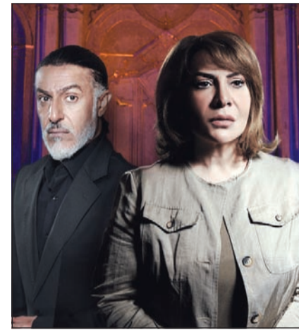
مسلسل «عطر الروح»

بعد أن رصدنا آراء النقاد في مسلسلات رمضان من النواحي الفنية من خلال جائزة «شعلة الأنباء» السنوية الأسبوع الماضي، أجرينا استبيان «الأنباء» الرمضاني على عينة عشوائية من 500 مشترك في مختلف محافظات البلاد. وأظهرت نتائج الاستبيان الجماهيري توزعاً كبيراً للأصوات على خلاف المواسم الماضية وينسب متقاربة جداً بين 8 مسلسلات تراوحت بين 12 و8% مع تقدم بسيط لمسلسل «عبرة شارع» الذي احتل الصدارة، يليه مباشرة «الخطايا العشر»، ثم «مع حصّة قلم» و«محطة انتظار» و«الخافي أعظم» و«روتين» و«عطر الروح» و«العاصوف». وقراءة هذه النتائج تدل على أن معظم الأعمال قد حظيت بالمشاهدة هذا الموسم واستقطبت الجمهور من جميع الفئات، ولا يمكن الحديث عن اكتساح أي منها أو استئثار مسلسلين بالغالبية وانقسام المنافسة الجماهيرية بينهما كما كان يحصل في المواسم السابقة.