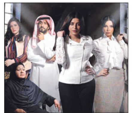
مسلسل «خديت من عمري وعطيت»