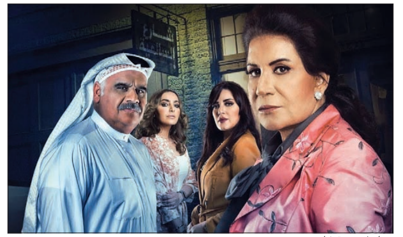
مسلسل «عبرة شارع»

بعد رأي النقاد ونتائج «شعلة الأنباء».. «الأنباء» استطلعت رأي مشتركها