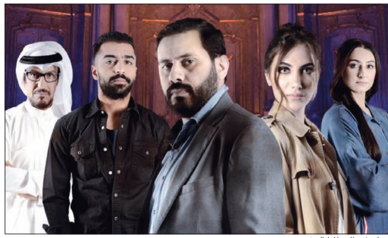
مسلسل «الخطايا العشر»