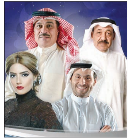
مسلسل «الخافي أعظم»