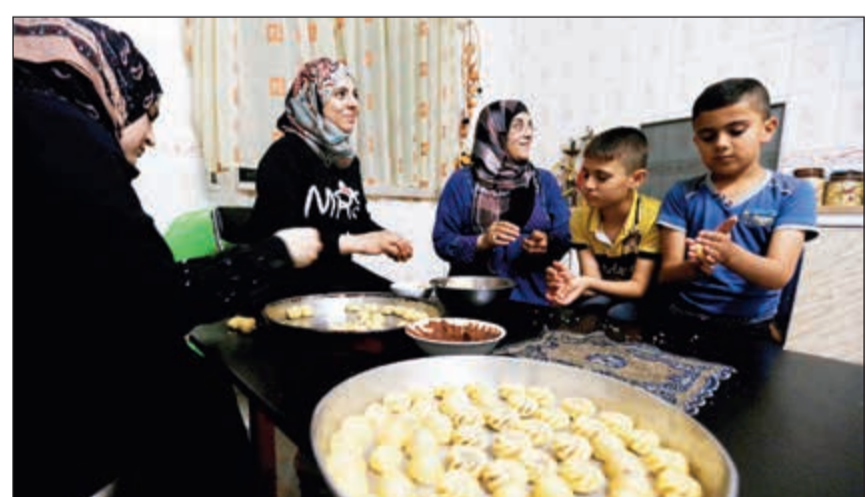
عائلة سورية لاجئة في الأردن تحضر المعول استعدادا للعيد

الدائمة أن تدعو الدول لتبني موقف متوازن ومنع أي أعمال قد تؤدي إلى تفجر عواقب وخيمة وزعزعة وضع هش بالفعل».