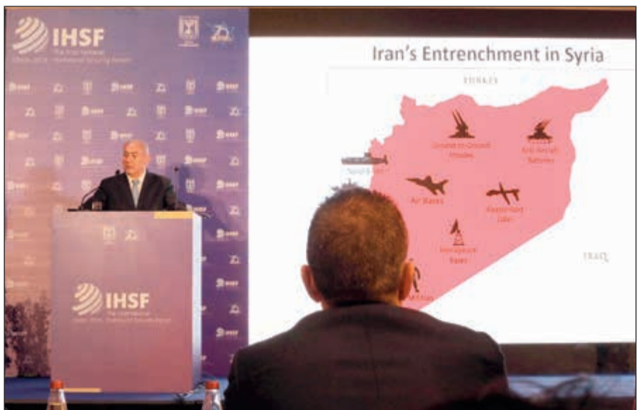
رئيس الوزراء الإسرائيلي بنيامين نتنياهو يعرض خريطة للمواقع الإيرانية في سورية والأسلحة التي تخزنها فيها

عواصم - رويترز: قال رئيس الوزراء الإسرائيلي بنيامين نتنياهو إن إسرائيل هاجمت مقاتلين شيعية مدعومين من إيران في سورية، معتبرا أن مثل هذا العمل قد يساعد في وقف موجة النزوح الجماعي للاجئين السوريين إلى أوروبا. وكشف مسؤولون إسرائيليون من قبل عن شن عشرات الضربات الجوية في سورية لمنع نقل أسلحة إلى مقاتلي حزب الله اللبناني أو إلى نشر قوات وأسلحة إيرانية في سورية. لكن نادرا ما تحدث هؤلاء المسؤولون عن تفاصيل بشان العمليات أو تحدثوا عن استهداف مقاتلين غير لبنانيين. واتهم نتنياهو إيران بجلب 80 ألف مقاتل