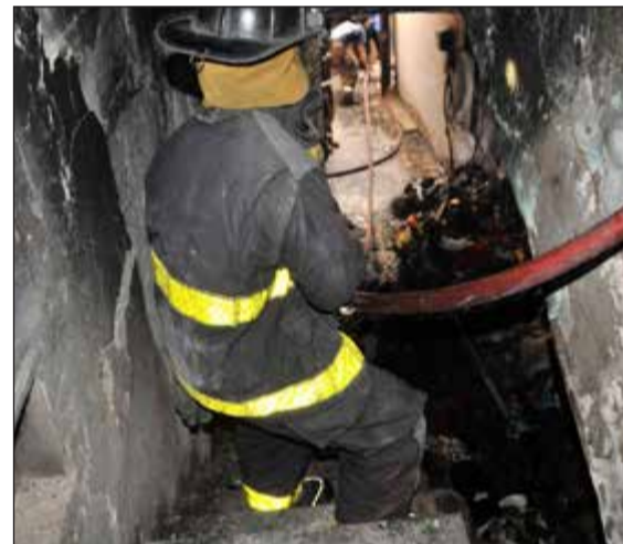
الحريق خلف تلفيات بالغة بالمنزل

مما ساهم في احتجاز عدد من الأشخاص. هذا وباشرت فرق الإطفاء باقتحام المنزل وتم إنقاذ 7 أشخاص مصابين جميعهم من النساء وكانت هناك إصاباتان خطرتان تم نقلهما عن طريق الطوارئ الطبية إلى مستشفى ابن سينا، أما الحالات الأخرى فكانت مصابة بصروق متفرقة ونقلت إلى مستشفى الفروانية، وتم العثور على امرأة وطفلة كانتا متوفيتين. وختمت إدارة العلاقات العامة والإعلام بيانها بأن التحقيق جار لمعرفة الأسباب التي أدت إلى وقوع الحادث. هذا وتناشد الإدارة المواطنين والمقيمين التقيد بإرشادات الأمن والسلامة حفاظاً على سلامتهم مع مراعاة عدم استخدام السكن الخاص وتحويله إلى