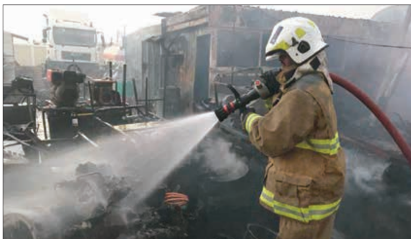
.. واطفائي يتعامل مع حريق سكن العمال بالماء