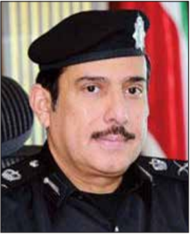
اللواء عبدالله الهاجري

كشف مصدر امني مطلع ان رجال هجرة الفروانية بقيادة العقيد فهد الهاجري بذلوا جهودا كبيرة خلال شهر رمضان المبارك، ورغم قصر فترة الدوام نسبيًا استطاعوا خلال هذا الشهر إنجاز 67350 معاملة تنوعت بين زيارات بصورها المتنوعة والتحاق بعائل وإقامات عمل. وقال المصدر ان العقيد الهاجري التزم بتنفيذ تعليمات المدير العام لشؤون الإقامة اللواء طلال معرفي ومساعدته اللواء عبدالله الهاجري بشأن سرعة إنجاز المعاملات وهو ما تطلب حرص جميع موظفي هجرة الفروانية على التواجد