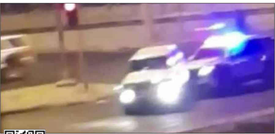
إحدى دوريات النجدة تلاحق قائد المركبة الهارب

تمكن رجال الامن العام من الإلقاء القبض على مواطن بتهمة الإجهار بالإفطار ومحاوله دهس أفراد نقطة تفتيش والهروب. وبحسب بيان للداخلية فإنه وأثناء عمل نقطة تفتيش على طريق المقبرة توجهت الى التفتيش مركبة نيسان جيب ابيض اللون وعند وصولها لنقطة التفتيش لاذ قائدها بالفرار محاولاً دهس أفراد النقطة وكان مجاهرًا بالإفطار (تدخين)