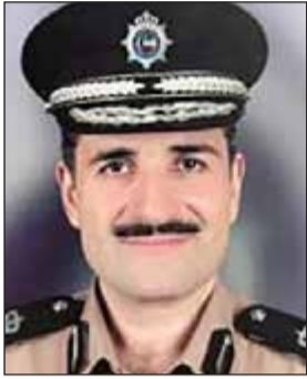
اللواء طلال معرفي