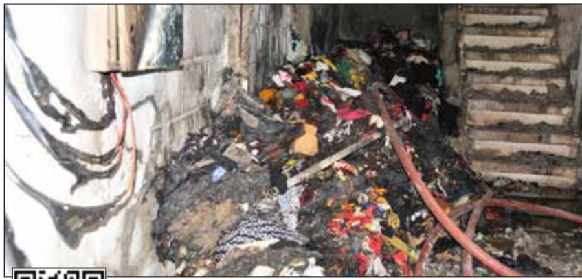
.. وكشف عن مهملات اعانت عمليات الانقاذ