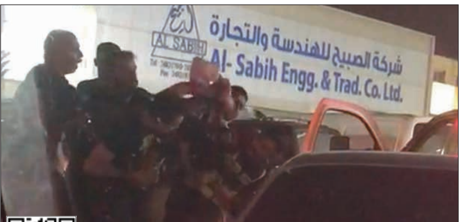
من الواقعة التي تم تداولها بشكل مغلوط على شبكات التواصل الاجتماعي

نفت وزارة الداخلية ان تكون الواقعة التي تم تداولها وتعلقت بتشابك الأيدي بين شخص ورجال أمن بأنها اعتداء على رجال الأمن. فقد ذكرت الإدارة العامة للعلاقات والإعلام الأمني بوزارة الداخلية في بيان توضيحي لقطع فيديو تم تداوله على مواقع التواصل الاجتماعي الاعتداء على أفراد دورية نجدة هو في الحقيقة سيطرة أفراد الدورية على وافد من إحدى الجنسيات العربية لم يمثل للأوامر ولم يكن هناك أي اعتداء من قبيل الوافد على أفراد الدورية نهائياً. وفي الطرفان عن بعضها بعضاً.