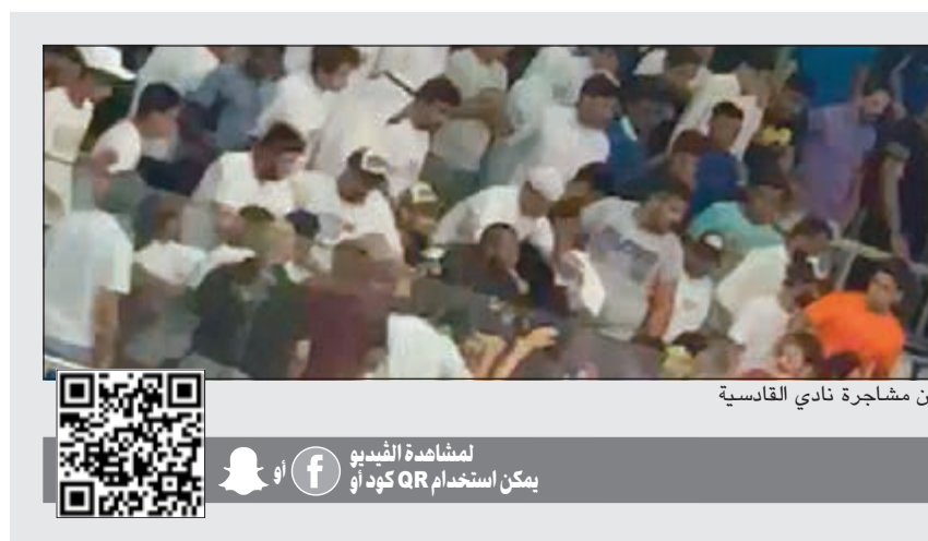
من مشاجرة نادي القاسية

الى حريق منزل مكون من ثلاثة أدوار، وعند الوصول الى موقع الحادث تبين أن الحريق نشب في غرفة تقع بالدور الأرضي وامتد الى مخزن من الألمنيوم في حوش المنزل يحتوي على اطارات واسطوانات للغاز، هذا وباشرت رجال الإطفاء مكافحة الحريق