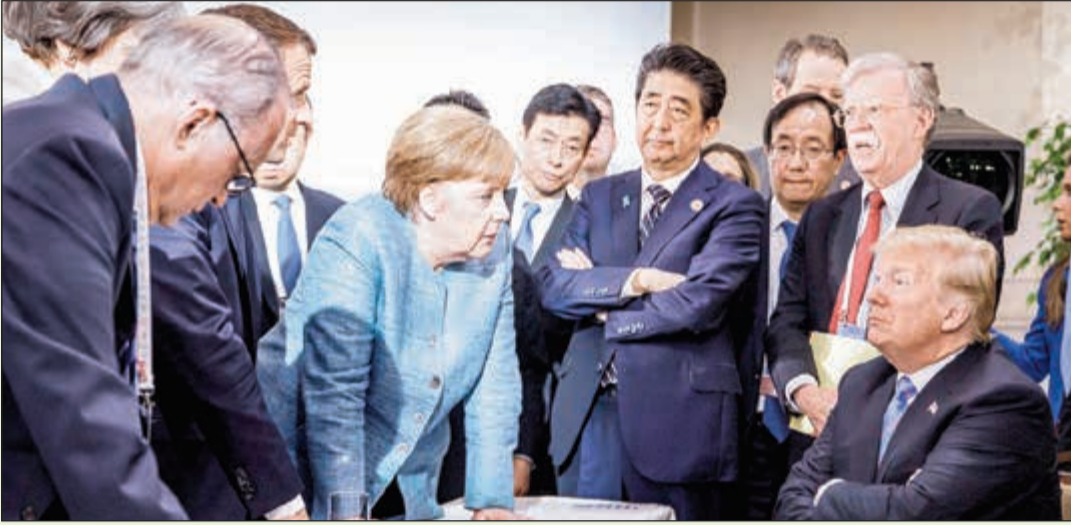
انقسامات حادة بين الدول الأعضاء في مجموعة السبع حول التجارة

الجمركية التي فرضها تهدف إلى حماية الصناعة والعمال الأميركيين من المنافسة العالمية غير العادلة في إطار جدول أعماله تحت شعار «أميركا أولاً».