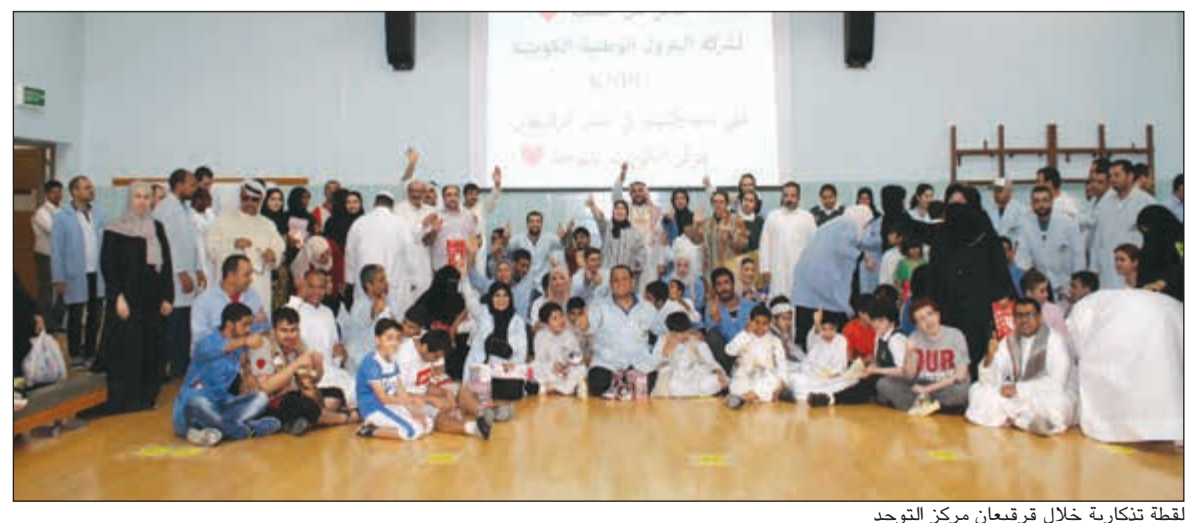
لقطة تذكارية خلال قرقيعان مركز التوحد