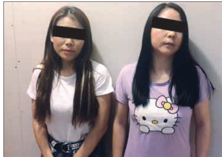
الآسيويتان بعد ضبطهما

اقتيدت وافدتان آسيويتان إلى الإدارة العامة للمباحث الجنائية للتحقيق معهما في امتهان أقدم مهنة في التاريخ على أن تخضعا للتحقيقات إضافية على خلفية عدم وجودهما في قاعدة بيانات الداخلية.