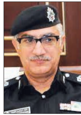
اللواء إبراهيم الطراح