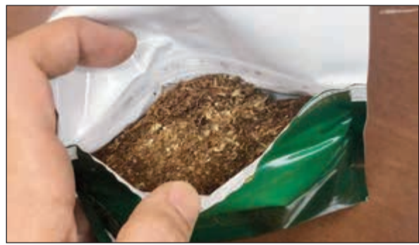
تبغ مخلوط بمواد مخدرة

وحول تفاصيل الضبطية ذكر مدير إدارة الجمرات الجوي وليد الناصر، أن أحد المفتشين اشتبه في وافد عربي قادم من دولة أوروبية، فقام بإخضاع حقيبته للتفتيش اليدوي، وتبين وجود «الماريغوانا» في عبوة تبغ وحلوى، وأفاد المهرب