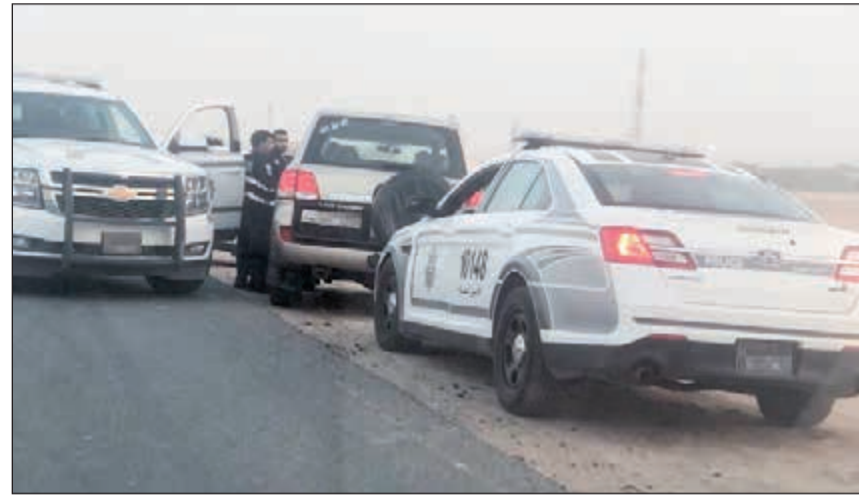
السيارات التي تم ضبطها

شن رجال الأمن حملة على إحدى طرقات بر رحية بعد أن أجاز الفجر لضبط المستهترين، وكانت معلومات قد وردت إلى أجهزة الداخلية بتجمع مجموعات من الشباب تضم كل منها العشرات، ويقوم بعضهم بالمجاهرة بالإفطار والتجمهر الذي تبدأ معه حلقات الاستهتار التي فاجأها الانتشار الأمني