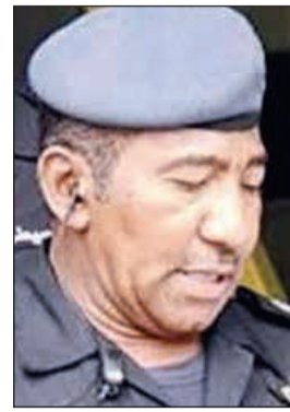
اللواء علي ماضي

لرجال الأمن العام وبمشاركة من رجال النجدة والمباحث، وتم يوم أمس فقط حجز 11 شاباً متجمهرين وحجز 7 مركبات رياضية قبل وصولها الي نقطة تجمع المستهترين الذين تركوا وراءهم قطع الإطارات، وذكر مصدر أمني أن الجامعات الشبابية اختارت هذا المكان بعد أن أنهى رجال الداخلية تجمعهم في السابق على طريق الأرتال. وكان المستهترون قد اتخذوا بر