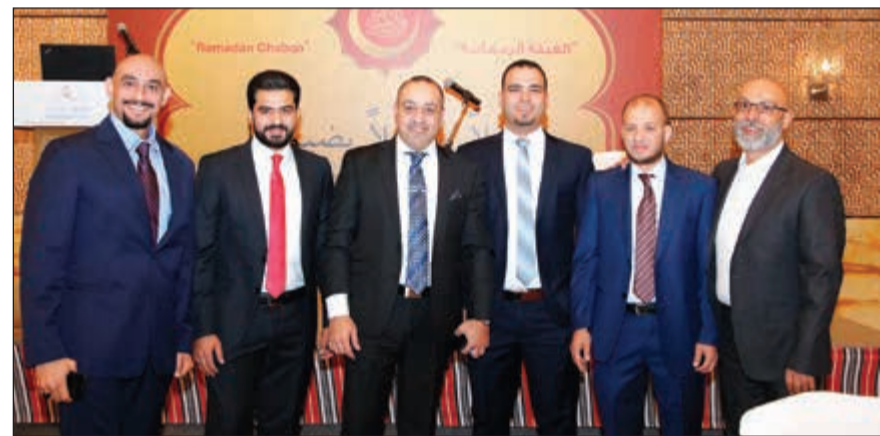
فريق مبيعات إيسوزو

من جهود في مواكبة التطورات التكنولوجية في عالم صناعة الشاحنات والمركبات وحرصها على تعزيز منتجاتها بكل ما يزيد من قدرتها وكفاءتها بما فيها أنظمة السلامة والأمان.