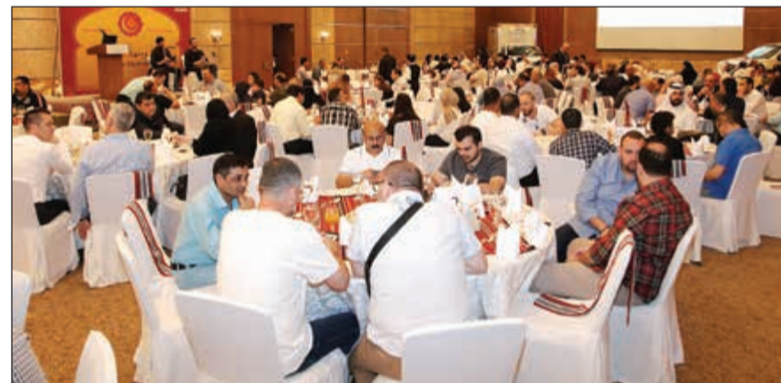
حضور مميز في غبة إيسوزو

إيسوزو من أفضل الشركات اليابانية المتخصصة في إنتاج وتطوير شاحنات عالية الجودة N-Series ويك Ab D-Max التي تعتبر الشريك المثالي للعملاء من أصحاب الأعمال وللأفراد،