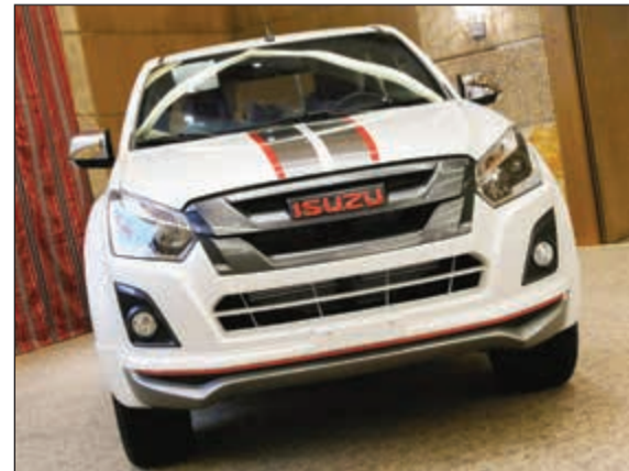
سيارة Isuzu D-Max