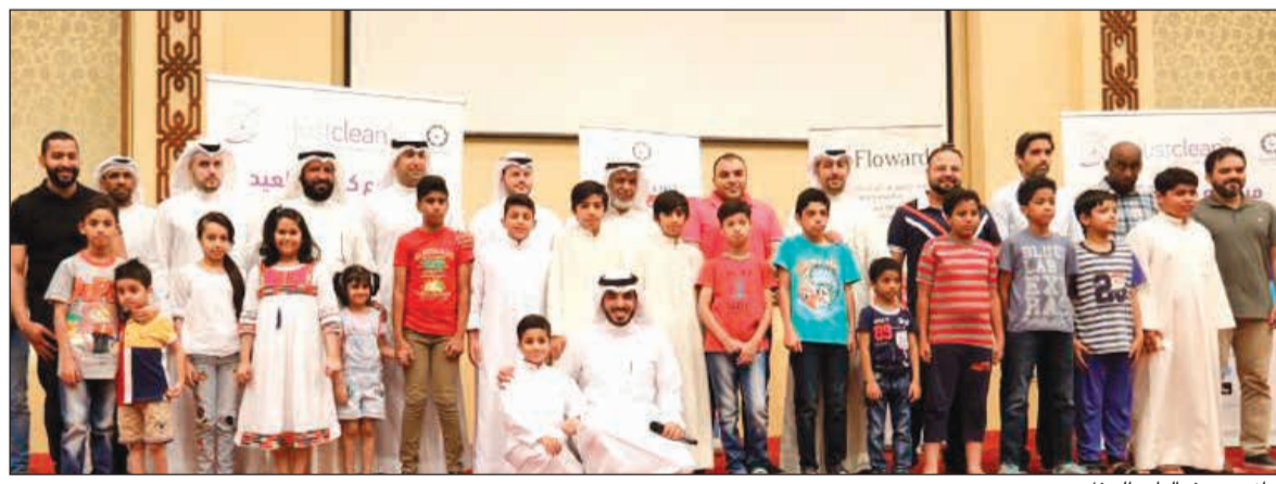
جانب من فعاليات الحفل