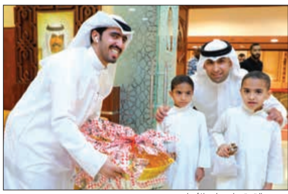
توزيع القريعات على الأيتام

جست كلين، جمال الأنصاري، وصانوا رب العزة سبحانه ورسولنا الكريم ﷺ بالأيتام خيرا، وانطلاقا من دورنا تجاه المسؤولية المجتمعية نشرك في هذا العمل الخيري الرائد الذي من خلاله رسمنا البسمة على وجوه الأيتام وتبوتيق من الله سنستمر في دعم هذا العمل المبارك. وتقدم بشكر النجاة الخيرية، مثمنا دورها الرائد الذي تقوم به داخل الكويت وخارجها، مؤكدا أن شراكة جست كلين مع النجاة الخيرية مثال يحتذى به، ولدينا في القريب العاجل العديد من الفعاليات والأنشطة الإنسانية التي ننفذها بالتعاون مع النجاة الخيرية.