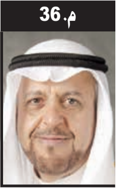
36 م. الإسلامي التي عقدت في اسطنبول 18/5/2018. عملت