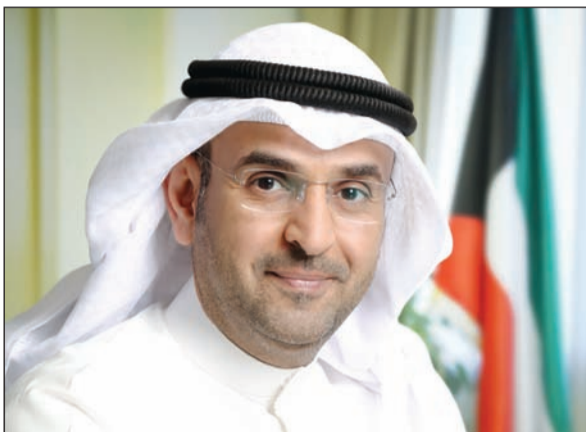
د. نايف الجرف

أعلن وزير المالية د. نايف الجرف عن تشكيل لجنة لتقصي الحقائق فيما أناره عدد من النواب من ملاحظات حول عملية تخارج المؤسسة العامة للتأمينات الاجتماعية من شركة «إياس للتعليم الأكاديمي والتقني»، إحدى الشركات المحلية بالكويت. وقال الجرف: «نقدر ونحترم آراء النواب فيما أناره وأن جميع الملاحظات محل نظر ونؤكد حرصنا الكامل على حماية الأموال العامة والتصدي لكل محاولات التعدي عليه في أي شكل من الأشكال وعلى ضوء تلك الملاحظات فقد قمنا بتشكيل لجنة لتقصي الحقائق في حول صفقة بيع حصة المؤسسة العامة للتأمينات الاجتماعية في «إياس للتعليم الأكاديمي