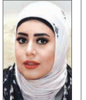
الحامية منى الأريش

قضت محكمة الجنابات بحبس موظفة في وزارة الصحة 3 سنوات مع تغريمها مبلغ 8 آلاف دينار عن تهمة طلب رشوة مالية من قبل أحد المواطنين. وأحيلت المتهمة إلى المحاكمة بعدما ضبطت من قبل رجال المباحث الجنائية بكمين تلقت خلاله مبلغ 4000 دينار من أحد المراجعين مقابل تحديد موعد له مع طبيب اجنبي زائر.