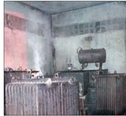
أجزاء المحول تمحمت بفعل الحريق

تلقى بلاغا قبل الإفطار بالحريق ففرع رجال إطفاء مركزي مشرف وصحان الى موقع الحريق واخمداه، فيما لم تسجل اي اصابات بشرية واقتصرت الأضرار فقط على الماديات الناتجة من الحريق.