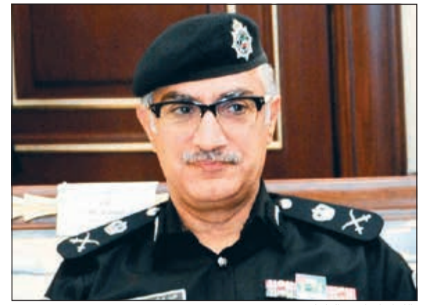
اللواء إبراهيم الطراح

خدمة في محافظة الاحمدي استغل مهام عمله كموظف في المركز وقام بتغيير إقامة العامل الهندي الذي يعمل لديه الى سائق، وأضاف المصدر: تم فتح تحقيق في الواقعة وتبين ثبوت ما حدث، وتم ضبطه، وبمواجهته بالتحريات بعد