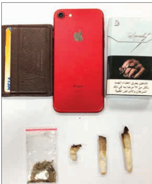
كيس الكيميكال ويقايا السجائر الملوثة بالخشيش