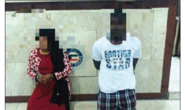
الوافدان بعد القبض عليهم