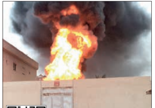
حريق المحول خلف سحب دخانية كثيفة