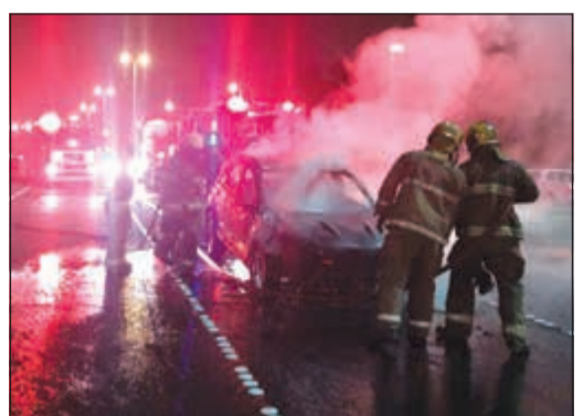
رجال الإطفاء يخمدون النيران التي شبت في مركبة