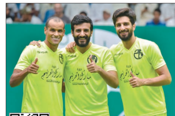
ريفالدو مع لاعبي القاسية فهد الأنصاري وسعود الجمد خلال مشاركته في دورة الخريجين الرمضانية