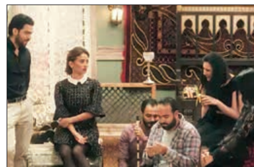
مسلسل ممنوع الاقتراب أو التصوير»

زينة في مسلسل «ممنوع الاقتراب أو التصوير»: «في سنات وشها من غير ماكياج شبه وش رجلي بالضبط.. بالذمة هذا كلام ينقال».