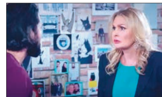
مسلسل «لدينا أقول أخرى»

نتفهم لجوء بعض صناع الدراما إلى إعادة بعض المشاهد من الحلقة السابقة حتى يصلوا إلى مدة الـ 30 دقيقة للحلقة لعجزهم عن خلق خطوط درامية جديدة، ولكن أن يصل عدد المشاهد المعتادة في مسلسل «لدينا أقول أخرى» بطولة الفنانة يسرا إلى أكثر من 9 مشاهد فهذا ممكن الاستغراب.. نحننا نقول عيدوا الحلقة كلها مو ابرك.