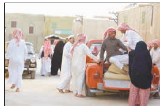
مشهد من «العاصوف»