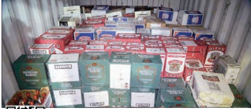
الخمور المهربة نقلت إلى أحد الشاليهات وأعيدت إلى ميناء الشويخ