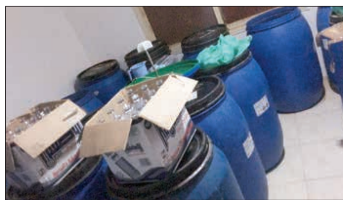
الخمور داخل البراميل تمهيدا لتفريغها في الزجاجات

2187 ديناراً، هذا وقال مصدر أمني أن الخمور المضبوطة تبين أن الوافدين الثلاثة يقومون بإعادها على مقربة من المراحيض.