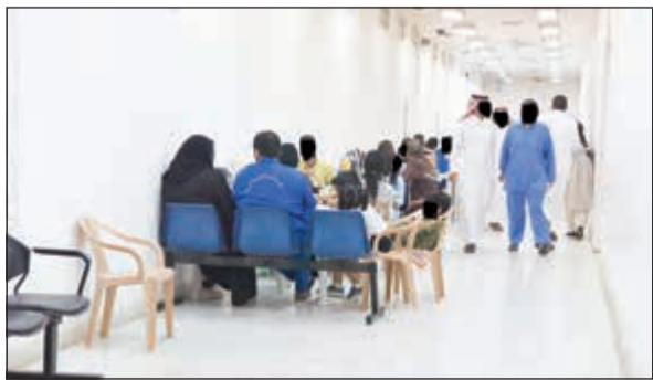
من الإفطار الجماعي للنزلاء وأسره

لتوجيهات معالي نائب رئيس مجلس الوزراء ووزير الداخلية الفريق م. الشيخ خالد الجراح، والتي يتابع تنفيذها على أرض الواقع وكيل وزارة الداخلية الفريق محمود الدوسري، حيث إن هذه المبادرة تحقق مردوداً إيجابياً على سلوكيات النزلاء وتزيد من توطيد العلاقات مع أسرهم وتؤكد المزيد من العلاقات الإنسانية الطيبة بما يتميز بها هذا الشهر الفضيل من