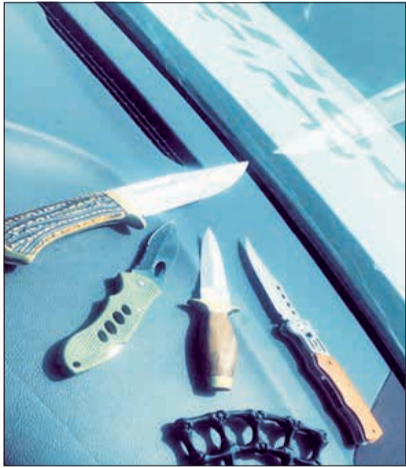
الأدوات الحادة المضبوطة بحوزة المواطن