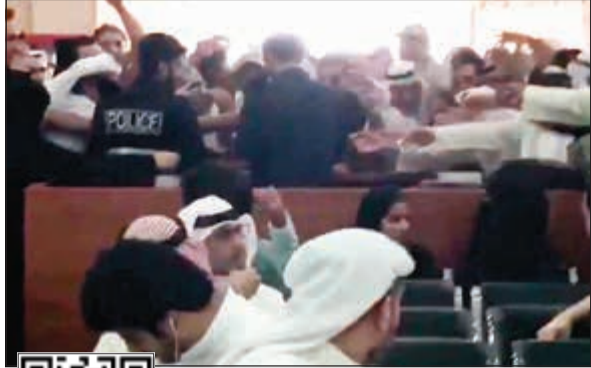
مراكز الخدمة شهدت ازدياداً شديداً

باتي ذلك في إطار جهود وزارة الداخلية لتبسيط الإجراءات وسرعة إنجاز المعاملات وعملاً على توفير الجهد والوقت على المواطنين وبناء على تعليمات نائب رئيس مجلس الوزراء ووزير الداخلية الفريق م. الشيخ خالد الجراح، ومتابعة وإشراف وكيل وزارة الداخلية الفريق محمود الدوسري. وأوضحت الإدارة العامة للعلاقات والإعلام الأمني أن اتخاذ قرار فتح مراكز الجواز الإلكتروني خلال هذه الفترة جاء لتسهيل والتخفيف على