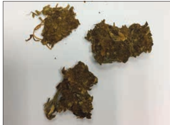
الماريغوانا المضبوطة في مطار الكويت الدولي

المهم في إحباط تهريب المواد المخدرة، منسيرا إلى أن مفتشا جمركيا اشتبه في واقعة أسوي، فقام بإحضار حقيبتة للتفتيش البدوي، وتبين وجود «الماريغوانا» بين ملبسه، وقد أفاد المهرب بأن المخدر المضبوط للتعاطي. فمن الناصر، دعم الإدارة العامة للجمارك لجهود