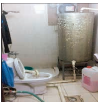
الخمور المحلية تعد بجوار المراحيض