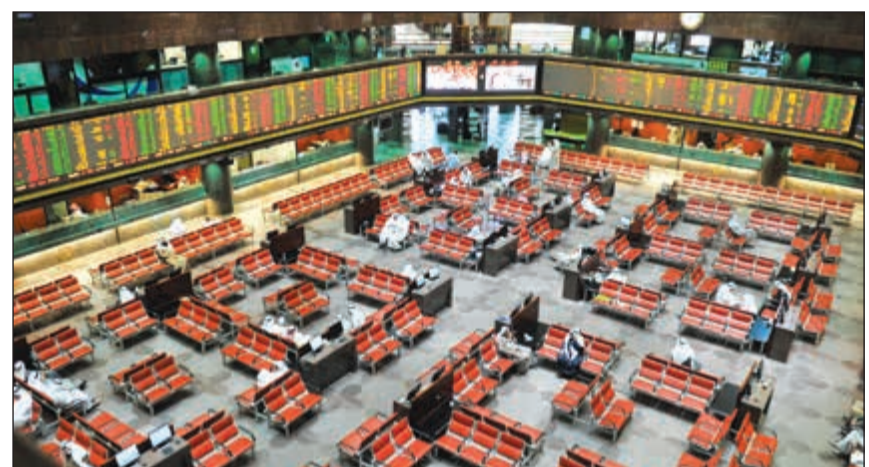
ارتفاع جميع مؤشرات البورصة نهاية الأسبوع

● حقق المؤشر الأول مكاسب بنسبة 2% محققا 97 نقطة ليصل إلى 4787 نقطة، ارتفاعا من 4690 نقطة. ارتفع المؤشر الرئيسي بنسبة 0,4% بواقع 21 نقطة، ليصل المؤشر إلى 4837 نقطة ارتفاعا من 4816 نقطة.