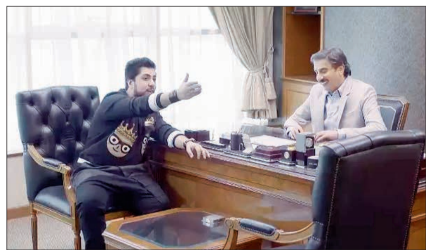
مشهد من «المواجهة»