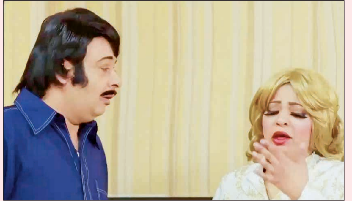
البلام أثناء تقليده إحدى الشخصيات