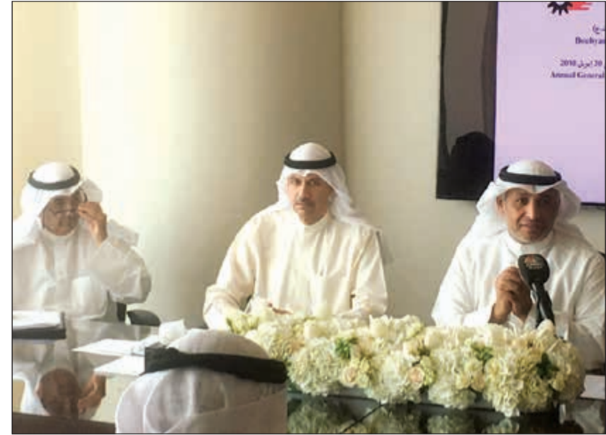
جانب من عمومية «بوبيان للبتروكيماويات»

وأشار إلى ان مجلس الإدارة كان قد اتخذ قراراً بأخذ مخصصات غير متكررة بهدف إظهار قيمة الأصول بصورة متحفظة في ميزانية الشركة في حين تم تسجيل بعض الأرباح غير المحققة خلال 2017، على النحو التالي: ● مخصص 15,25 مليون دينار يتعلق بشركات تابعة. ● مخصص 8,23 ملايين دينار يتعلق بشركات زمنية. ● مخصص 11,77 مليون دينار يتعلق باستثمارات متاحة للبيع. ● ربح غير محقق 8,77 ملايين دينار نتيجة إعادة تقييم استثمار متاح للبيع (للشركة)