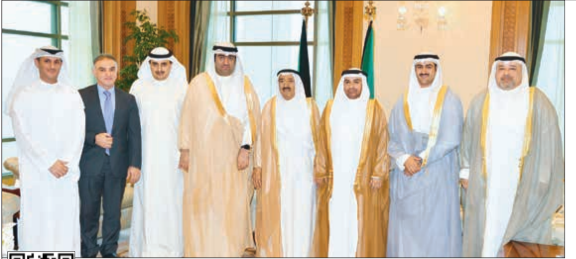
صاحب السمو الأمير الشيخ صباح الأحمد لدى استقباله الوزير خالد الروضان ومجلس إدارة المشروعات الصغيرة والمتوسطة الجديد

أظهرت وثيقة رسمية حصلت عليها «الأنباء» تحقيق الهيئة العامة للاستثمار صافي أرباح بقيمة 24,07 مليار دينار (ما يعادل 80 مليار دولار) عن استثمار احتياطيات الدولة، ممثلة في أصول الصندوق السيادي الكويتي خلال السنوات الثلاث من العام المالي 2015/2014 حتى العام المالي 2017/2016. وبذلك يصل متوسط صافي الربح السنوي لاستثمارات أصول الصندوق السيادي الكويتي خلال تلك الفترة إلى 26,5 مليار دولار بعائد 4,5٪ على الاستثمار على أساس تقديرات وكالة فيتش للتصنيف الائتماني لأصول الصندوق السيادي بقيمة 590 مليار دولار. وكان وزير المالية د.نايف الحجرف قد صرح في وقت سابق بأن أداء الصندوق السيادي جيد جدا وأنه لا يوجد تراجع أبدا في قيمة الأصول بل هي في نمو مستمر، أما البيانات التي يتم تداولها فما هي إلا تقديرات جهات خارجية غير مطلعة. وقد أفصح الحجرف عن المبلغ التقريبي لإجمالي الأصول في صندوق الاحتياطي العام حتى نهاية السنة المالية السابقة (2017/2018) بالقول «بلغ إجمالي الأصول في صندوق الاحتياطي العام 26,4 مليار دينار تقريبا، موزعة بين الأصول النقدية وما يعادلها والتي تبلغ 13,2 مليار دينار تقريبا، واستثمارات غير سائلة بقيمة 13,2 مليار دينار تقريبا».