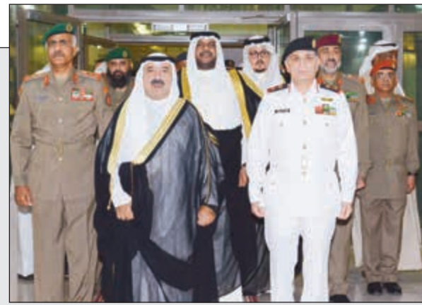
الشيخ ناصر صباح الأحمد لدى وصوله إلى كلية «مبارك العبدالله» للقيادة والاركان وفي استقباله الفريق الركن محمد الخضر والشيخ أحمد المنصور والفريق الركن عبدالله النواف واللواء الركن بحري عبدالله دشتي

ناصر صباح الأحمد كرم خريجي دورة القيادة والاركان المشتركة الـ22: مستوى كلية «مبارك العبدالله» يضاهاى أرقى الكليات العسكرية العالمية 05