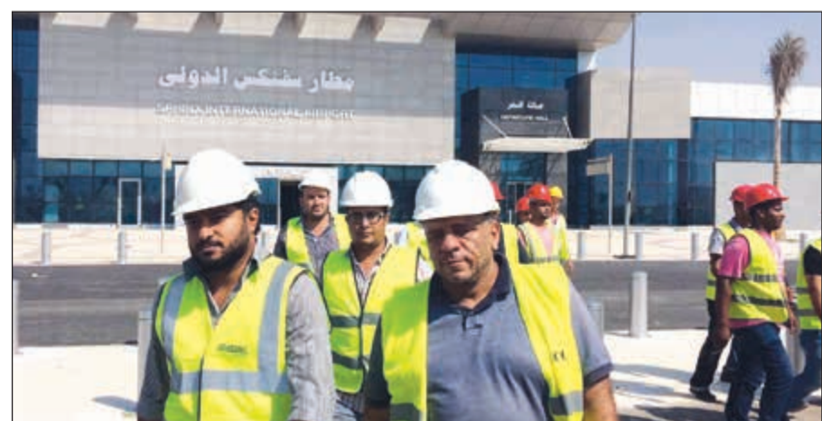
مطار سفنكس يستعد للإدراج ضمن المطارات الدولية قريباً

وأشار الملا إلى أنه تم خلال الاجتماع تقييم موقف تنفيذ كل شركة وفقاً للبرنامج الموضوع وأكد أهمية التزام الشركات بتوقيتات التنفيذ لتحقيق هذه الخطة الطموح الجاري تنفيذها وتمت مناقشة التحديات واليات مواجهة تحقيق الهدف المطلوب.