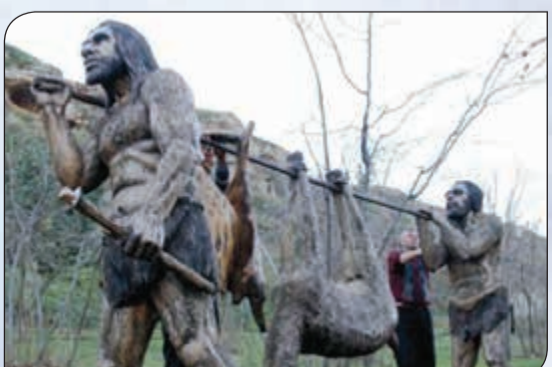
مجسمات للإنسان البدائي في منطقة كهوف توكاي