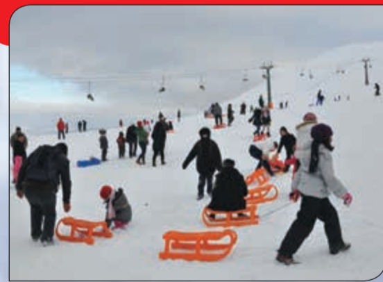
رياضة التزلج على الثلوج في سامسون

● كهوف توكاي: تقع في منطقة توكاي التي عاش فيها الإنسان البدائي، وقد قامت بلدية المنطقة ببناء كوخ على الطراز اليوناني ووضعت داخله نماذج للأدوات التي وجدت في المكان إضافة إلى نماذج عن الأسلحة والأدوات وتماثيل لجنود الحضارات التي عاشت في هذا المكان منذ آلاف السنين.