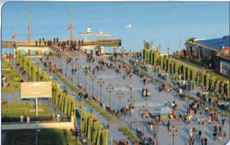
المشي السياحي في سامسون