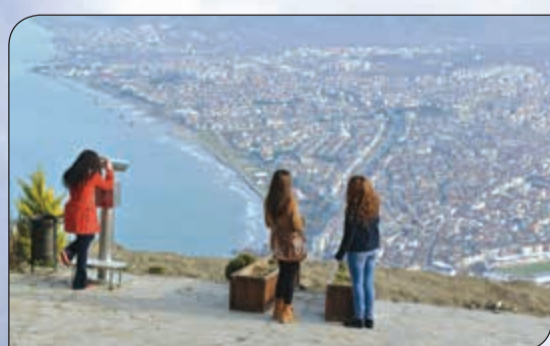
هكذا تبدو أورودو من ارتفاع 1500 متر عن سطح البحر