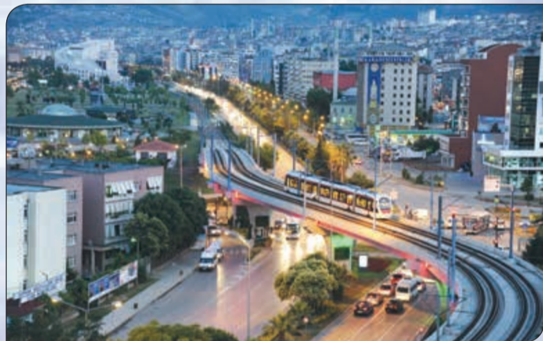
القطار الكهربائي أحد معالم مدينة سامسون

في مجال التجارة والنقل البحري إلى أوروبا، وبها المنطقة الصناعية المنظمة التي توفر العديد من الفرص لاسيما في مجال الطاقة، بالإضافة قطاع البناء والتطوير العقاري، مشيرا إلى أن الأرض التي توفرها الدولة للمستثمر شبيهة مجانية، بالإضافة إلى كهرباء منخفضة