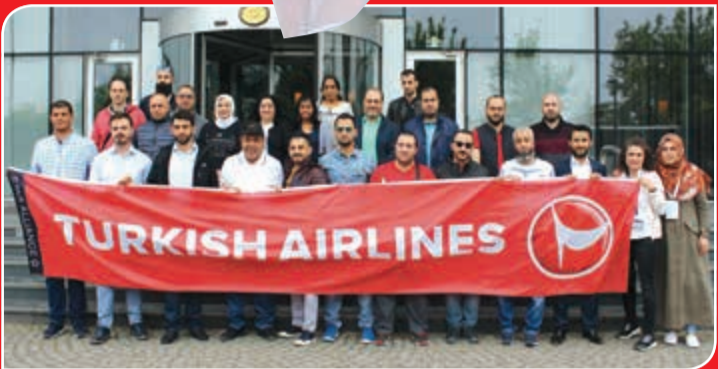
لفظة جماعية للوفد الكويتي الزائر لمدينة سامسون مع ممثلي شركة الخطوط الجوية التركية