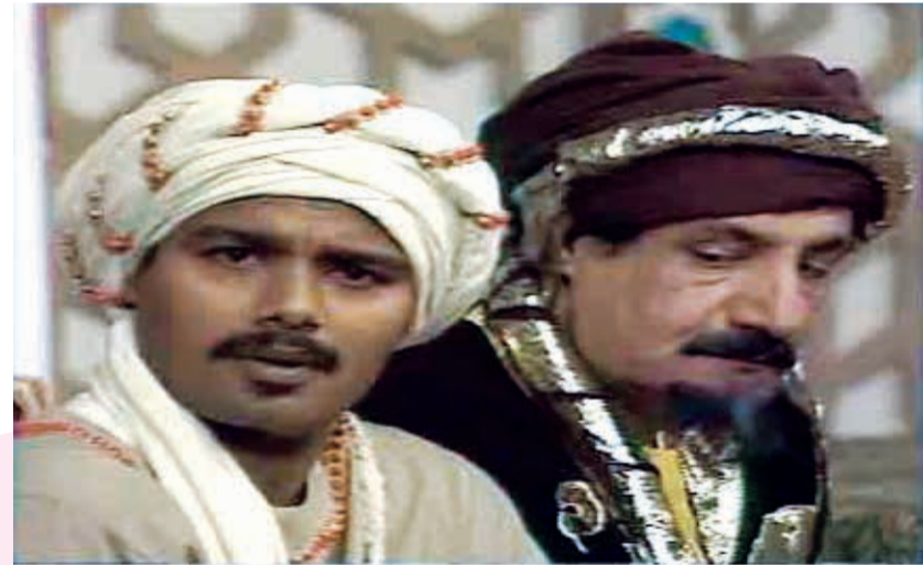
العقل مع الراحل احمد الصالح

زاوية نسلط الضوء فيها على أعمال لا تزال في ذاكرتنا وباللنا نحن لها كثيرا.