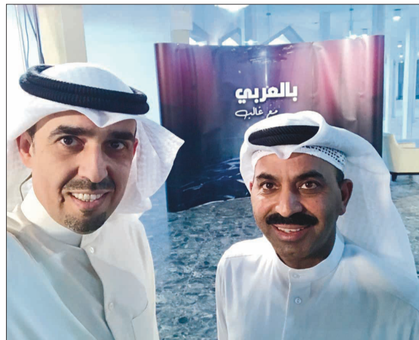
العلي مع العصيمي في البرنامج

يستضيف البرنامج الحواري «بالعربي مع غالب» الليلة الفنان د.طارق العلي، ويتناول في الحوار مسيرته وبصماته الفنية، إلى جانب أنه سيكشف عن مشروع اكتشاف المواهب الذي يعمل عليه في المملكة العربية السعودية، كذلك رسالة الدكتوراه، الخروج عن النص المسرحي، المسرح والدراما المحلية، الريادة الفنية، العمل مع عمالقة المسرح، الحرص في استقطاب الشباب.