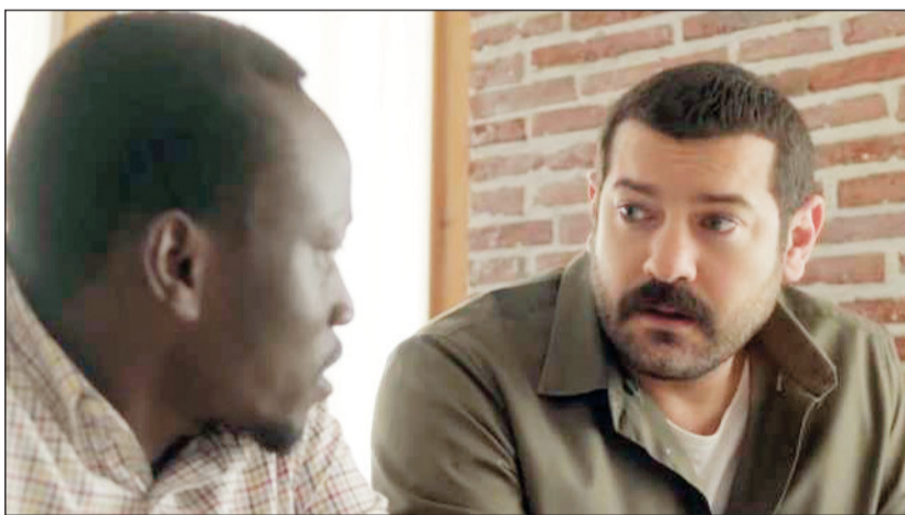
مشهد من مسلسل «طابع»

قدمه الفشني العام الماضي في مسلسل «واحة الغروب» مع نفس الأجواء.. شنو اليبدي يا جماعة الخير!