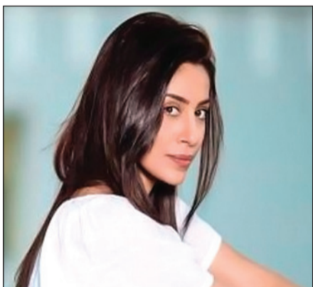
كوتور «إلهام علي»

زاوية تسلط الضوء على أهم الأعمال الدرامية والبرامج المنوعة المعروضة في شهر رمضان تنقدها أو تعلق عليها سواء بالإيجاب أو السلب.