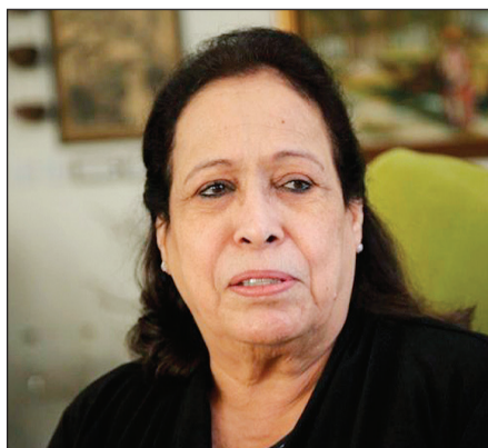
حصه «حياة الفهد»