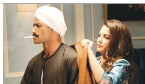
مسلسل «نسر الصعيد»

جماعة دراما رمضان هذا العام يبدو انهم لم يسمعو بالـ DNA فبعد السخرية الكبيرة من مسلسل مليكة بطولة دينا الشربيني لعدم خضوع البطلة لتحليل الـ dna لتتعرف على هويتها، ها هو مسلسل «نسر الصعيد» أيضا بطولة محمد رمضان الذي يحاول طوال الأحداث أن يثبت زواج ابن هتلر من الخادمة، ويثبت أنه هو من قتلها لكن لم يفكر للحظة أن يخضع الطفل وأبوه لتحليل الـ DNA!