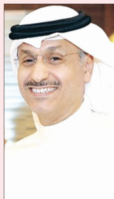
وكيل وزارة الإعلام طارق المرزوم

يعرض اهم المسلسلات يقدم التلفزيون باقة متنوعة من البرامج الدينية والكوميدية والحوارية التي ترضي كل الأنواق، واهم دليل عليها هذا التفاعل الكبير وغير المسبوق مع كل ما يعرض على الشاشة.