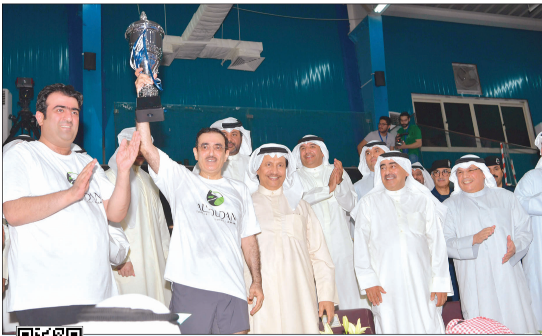
سمو رئيس الوزراء الشيخ جابر المبارك يشهد تتويج فريق الحكومة بكأس المباراة بين السلطتين بحضور الشيخ خالد الجراح وناصر الروضان.. وعبدالله الروضان يرفع الكأس وبجانبه خالد الروضان (قاسم باشا)