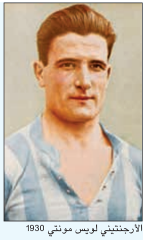
الارجنتيني لويس مونتي 1930