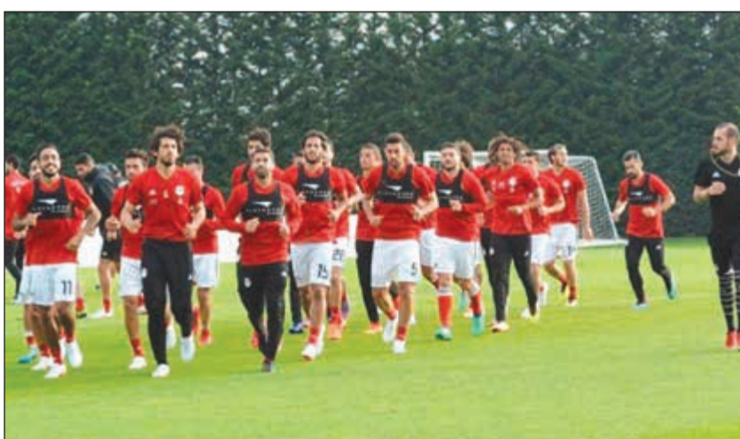
جانب من تدريبات المنتخب المصري

للفريق سيسافرون مع بعثة المنتخب إلى بلجيكا رغم استبعاد البعض قبل يومين من اللقاء. من جانبه، أكد رئيس الاتحاد المصري هاني أبو ريدة أن النجم محمد صلاح سيتواجد في احتفالية وداع المنتخب الوطني بالقاهرة، مضيفاً «نتواصل دائماً مع ليفريبول للاطمئنان على صلاح، حيث تم الاتفاق على عدم التعجل في قرار عودته للتدريبات ولكن هناك اتفاقاً على أنه سينضم للتدريبات بعد الوصول لمرحلة الاستشفاء بنسبة 80٪. والأسبوع المقبل سيحسم موقعه من التواجد في مباراة أوروغواي، علماً أن حالته تدعو للتفاؤل».