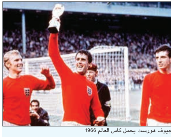
جيوف هورست يحمل كأس العالم 1966

وإيطاليا عام 1934. كتبت أسماء اللاعبين على قمصانهم للمرة الأولى في كأس العالم 1994 بالولايات المتحدة الأمريكية. ألغيت المسابقة عامي 1942 و1946 بسبب الحرب العالمية الثانية. وصل أكبر عدد من الجمهور في مباراة واحدة إلى 173,850 متفرجاً، وكان ذلك في المباراة النهائية لكأس العالم عام 1950 بين البرازيل وأوروغواي على استاد ماراكانا.