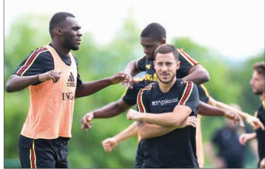
الجدة شعار تدريبات منتخب بلجيكا

(2-2)، وكانت قد أوقعت قرعة مونديال روسيا 2018 منتخب البرتغال ضمن المجموعة الثانية رفقة إسبانيا والمغرب وإيران. إلى ذلك عندما يحل المنتخب الألماني ضيفا على نظيره النمساوي في المباراة الودية