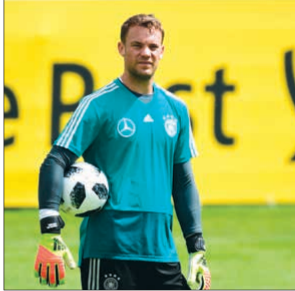
نوير.. هل يعود لمستواه القديم؟

ويقتصر على لوف، وعلى مدرسي باقي المنتخبات المشاركة بشكل أساسي على في المونديال، الإعلان عن