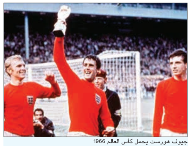
جيوف هورست يحمل كأس العالم 1966

وإيطاليا عام 1934. كتبت أسماء اللاعبين على قمصانهم للمرة الأولى في كأس العالم 1994 بالولايات المتحدة الأمريكية. ألغيت المسابقة عامي 1942 و1946 بسبب الحرب العالمية الثانية. وصل أكبر عدد من الجمهور في مباراة واحدة إلى 173,850 متفرجاً، وكان ذلك في المباراة النهائية لكأس العالم عام 1950 بين البرازيل وأوروغواي على استاد ماراكانا.