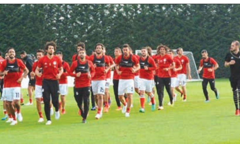
جانب من تدريبات المنتخب المصري