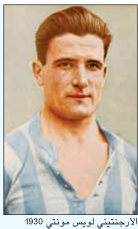
الارجنتيني لويس مونتي 1930