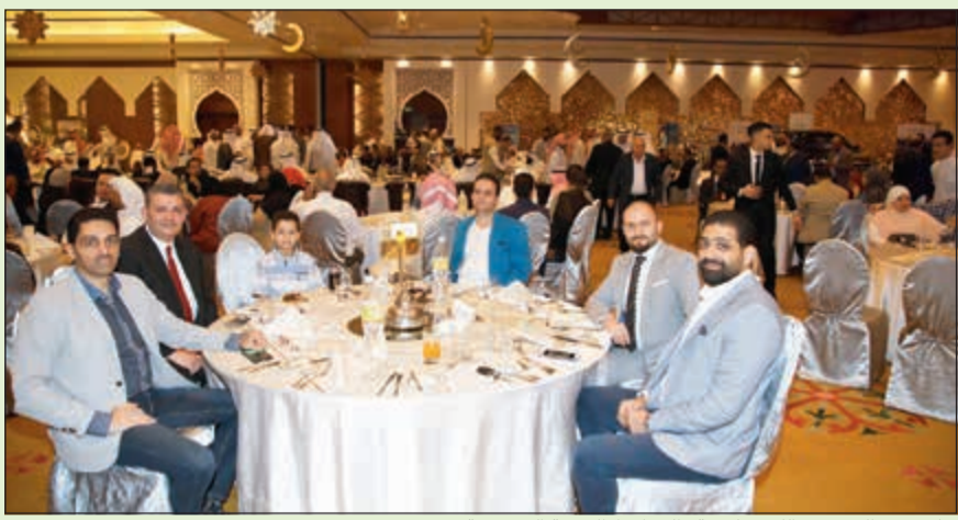
جانب من الحضور الكبير لغبة «الخطوط الجوية السعودية»

التي مقارنة بالفترة ذاتها من العام الماضي، مشيراً إلى أن هذه الأرقام المتنامية تأتي ضمن إنجاز مبادرات برنامج التحول الطموح الذي يجري تنفيذه حالياً في كل قطاعات المؤسسة وشركاتها ووحداتها الاستراتيجية ويهدف إلى تحقيق نمو شامل في مجموعة الخطوط السعودية عبر الاستثمار الأمثل للموارد البشرية وتحديث وتنمية الأسطول وتطوير المنتجات والخدمات ورفع الكفاءة وقال إن الخطوط أضافت