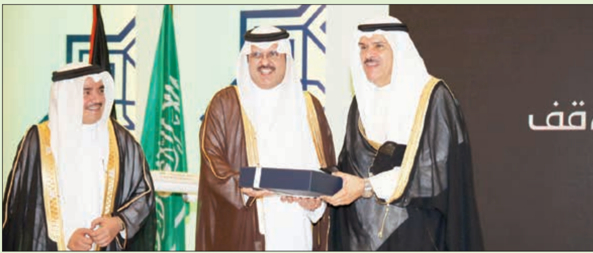
الأمير سلطان بن سعد كرمها الشيخ سلمان الحمود بحضور مدير «الخطوط السعودية» بالكويت فكري بن عبدالكريم الطويان

على هامش غبقتها الرمضانية السنوية.. وبنمو 91% عن العام الماضي