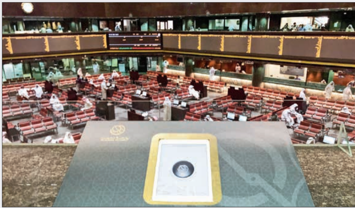
جرس البورصة يذق مستقبلا ضيفا جديدا بعد صمت دام لـ 3 سنوات

توقعت المصادر أن يتم الانتهاء من كل اجراءات الاكتتاب ما بعد الاغلاق خلال الاسبوع الجاري على ان تبدأ اجراءات الاكتتاب سريعا، وتوقعت المصادر ان يكون الإدراج بالسوق الأول ببورصة الكويت بعد عطلة عيد الفطر المبارك وقبل نهاية يونيو الجاري. وأكدت المصادر ان ادراج «المتكاملة القابضة» كسهم تشغلي يعتبر اضافة الى الاسهم الجيدة ببورصة الكويت وخاصة بالسوق الأول وان فرص اقبال صناديق الاستثمار بالمحافظ الاستثمارية على السهم خاصة بعد تاكد دخوله للسوق الأول، وازجعت ذلك الاقبال المتوقع الى المؤشرات المالية القوية للشركة والتي تفوق كثيرا من الأسهم المتداولة في السوق الأول، متوقعة ان يرتفع السعر الى قرابة الدينار في حالة توافرت الظروف المواتية بالسوق.