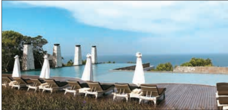
حمامات سباحة في أحد الفنادق بإطلالة ساحرة على البحر

على السواحل الممتدة لجزيرة بالي، أيدع الإندونيسيون في تشييد فنادق بمستوى خيالي من الجمال والروعة، وتتضمن هذه الفنادق الفخمة أجنحة الرفاهية والاستجمام، ليضفوا فيها أمتع الأوقات ويخرجوا منها بأجمل التذكيرات. في الجناح الواحد، فضلا عن قاعات الاجتماعات وصلات «الجم» والجاكوزي والمساح، والمرافق الخاصة بتسليم الأطفال، وكل ذلك بإطلالات ساحرة على البحر مع الطبيعة الخلابة الغنية بالأشجار الباسقة والأزهار الفواحة. أهم نقطة في هذه الخدمات إضافة