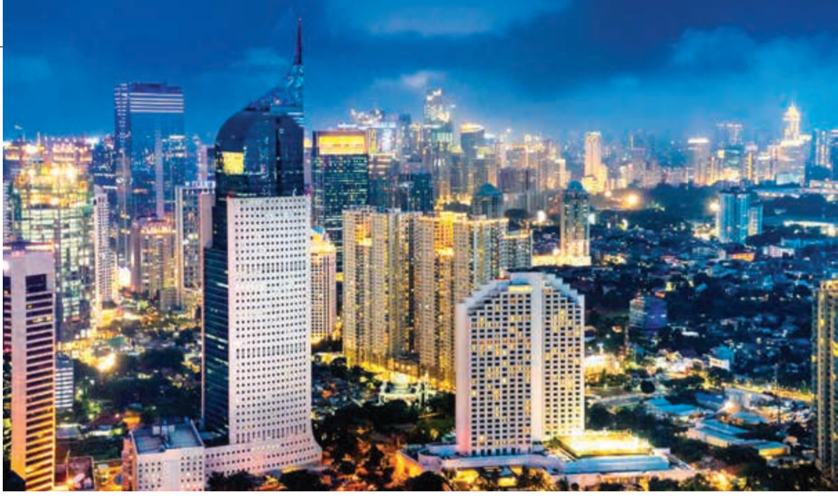
إطلالة من فوق برج سكاوي في العاصمة جاكرتا

رغم تنوع مقوماتها السياحية، تشتهر إندونيسيا أيضا بإنتاج البن، وقد تفنن أبناء هذه الدولة مترامية الأطراف في جعل أماكن تحميص وطحن البن مزارات جذابة تستقطب آلاف السياح كل يوم. وفي هذه الأماكن يرى الزائر أشجار البن والكاكاو وغيرها من الفواكه والخضراوات التي تشتهر بها إندونيسيا، ثم يطلع على مراحل إنتاج وطحن البن بشكل عملي قبل أن يتذوق عينات مجانية من القهوة بنكهات مختلفة. أمام حيوان «الوك» الصغير واللطيف، وقفنا لنستمع إلى طريقة إنتاج أحد أغلى أنواع البن في العالم، حيث يتخطى سعر الكيلو من هذا النوع 250 دولارا. تجمع حبوب البن الجديدة، وتقدم إلى حيوان اللوك فيبتلعها، لتفرز عليها معدته أنزيماتها، ومن ثم تمر بالدورة الكاملة في