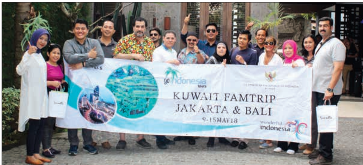
أعضاء الوفد أمام فندق سانكتو

ما أن وصلنا وصعدنا إلى المطعم، حمدت الله أنني تحاملت على شعوري بالتعب ورافقتهم في هذه السهرة، فقد وجدت نفسي أمام بانوراما ساحرة تطل على العاصمة جاكرتا من أعلى لتشهد أشهر معالمها. برج سكاى، هو ناطحة سحاب يقع وسط العاصمة جاكرتا، أما مطعمه الشهير فهو يقع في أعلى البرج وله ساحة كبيرة مفتوحة تمتد إلى الحاجز التاميني في محيط البرج، مع نافورة جميلة. وعلى أنغام الموسيقى الشرقية تارة والغربية تارة