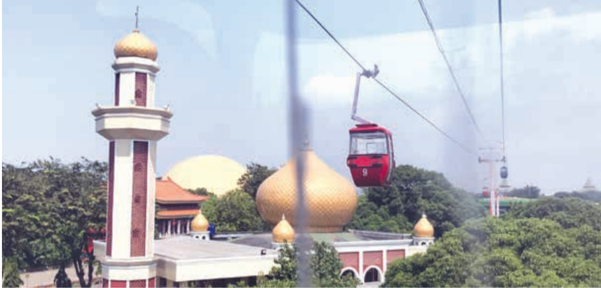
نموذج لأحد المساجد الكبرى موجود في حديقة تمان ميني