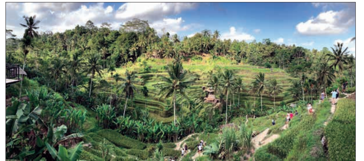
استغلال أمثل للطبيعة في زراعة الأرز وأشجار الفواكه

رغم أن نسبة المسلمين في إندونيسيا تصل إلى نحو 90% من عدد السكان إلا أن تلك الدولة الكبيرة فيها 5 ديانات أخرى، ومع ذلك فهي تشهد أعلى درجات التعايش السلمي بين أفراد الشعب، لاسمما أن الحكومة تكفل حرية العقيدة للجميع، وتحرص على احترام وتقدير عقائد كل ديانة، ليس ذلك فحسب بل وتمنح الموظفين عطلات رسمية في جميع المناسبات الدينية المختلفة الديانات.