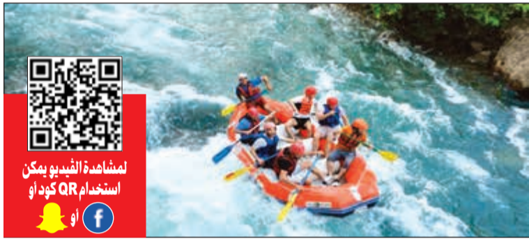
ثارة ومرح في رحلات الرافتنج

عاد قائد القارب ليخبرنا ببعض التعليمات حفاظا على سلامتنا وحرصا على مساعدتنا في الاستمتاع بالتجربة، ونحن بدورنا نحفظنا أنفسنا لدخول المنافسة مع القوارب الأخرى. ركبنا قاربنا وبدأ تحدينا، لنجد أنفسنا على موعد مع أعلى درجات الإثارة والمتعة والسعادة على مدى أكثر من ساعتين ونصف، فمع كل منحدر وعند كل شلال ودخل أي منعطف، كنا نشعر بالسعادة والبهجة، سواء ونحن نتجهد للقفز على الآخرين، أو ونحن نعبر تلك التحديات دون السقوط في النهر. على جانبي النهر توجد محطات للاستراحة فيها مقاه لتناول المشروبات أو الوجبات الخفيفة وأخذ مساحة من الوقت لالتقاط الأنفاس قبل مواصلة التحدي.