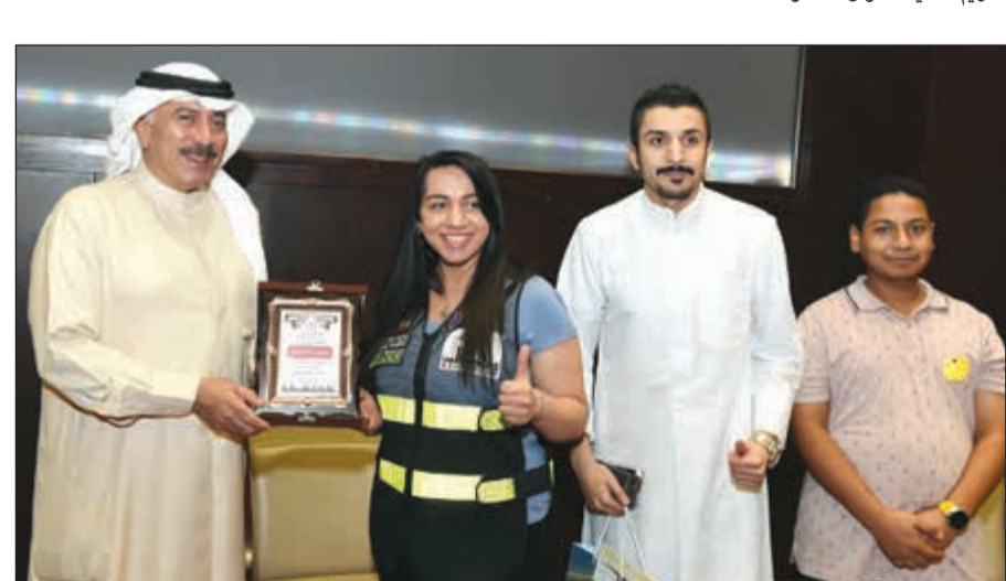
تكريم مجموعة بصمة عيال الكويت

وجه العطار الدعوة لكل المؤسسات والفرق التطوعية للمشاركة في هذا الملتقى الذي سيكون سنويا خاصة ان الملتقى يحوي حلقات نقاشية ومبادرات عديدة يتم طرحها مثل مبادرة أكفل يتيما لدينا مبادرة أكفل مدريا وهي الجديدة على مستوى الشرق الأوسط وتهدف الى ان تعلم الإنسان كيف يستطيع الحصول على قوته لا ان تعطيه فقط من منطلق علمني كيف اصطاد ولا تعطيني سمكة.