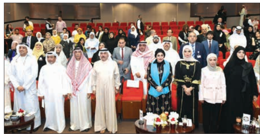
الفريق محمود الدوسري والشبكة نوال الحمود في مقدمة حضور الملتقى

وتقدمت بن سلامة بالتفاني والتبريكات لصاحب السمو الأمير الشيخ صباح الأحمد وسمو ولي عهد الامين الشيخ نواف الأحمد وللقائمين على برنامج البروتوجيز والداعمين والمواطنين بمناسبة شهر رمضان المبارك.