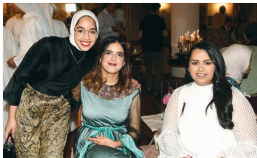
من الحاضرات في الغبقة