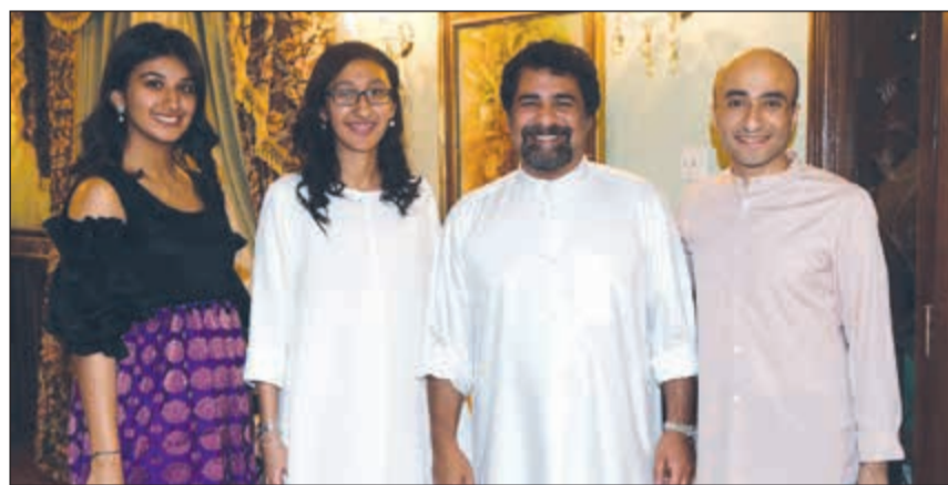
شملان البحر ويعرب بورحمة ومشاركات بالغبقة