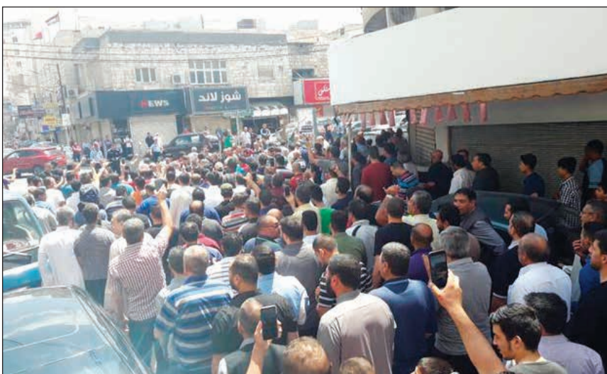
مسيرة في مدينة إربد أمس احتجاجا على قانون الضريبة ورفع الأسعار

عواصم - وكالات: أو عز العاهل الأردني الملك عبدالله الثاني الى حكومة هاني الملقى بتجميد زيادة الأسعار على المحروقات والكهرباء «نظرا للظروف الاقتصادية»، خلال شهر رمضان المبارك. ووجه رئيس الوزراء الأردني وزراء الصناعة والتجارة والتنمية والمالية والطاقة والثروة المعدنية بعقد اجتماع للجنة تسعير المشتقات النفطية لوقف قرار تعديل تعرفه المحروقات، بحسب ما أوردت وكالة الأنباء الأردنية الرسمية (بترا) أمس. وفي وقت لاحق، قالت اللجنة المعنية في بيان: «إنه تنفيذا لتوجيهات الملك عبدالله الثاني واستنادا لقرار رئيس الوزراء، فقد اجتمعت وقررت وقف العمل بقرار تعديل تعرفه المشتقات النفطية لشهر يونيو الجاري». وقررت اللجنة تثبيت جميع أسعار المشتقات النفطية لشهر يونيو وبقاء العمل بتسعيرة شهر مايو المنصرم. وفيما شهدت العاصمة عمان وعدد من المدن احتجاجات على القرار الحكومي، طالب حزب «جبهة العمل الإسلامي» بإجراء انتخابات مبكرة وتشكيل حكومة إنقاذ وطني. وجدد الحزب الذي يعد الأذرع السياسية لجماعة الإخوان المسلمين في الأردن في بيان أمس مطالبته بسحب مشروع قانون ضريبة الدخل، مشددا على ضرورة رحيل ما وصفها بـ «حكومة الأزمات»..» التفاصيل من 32