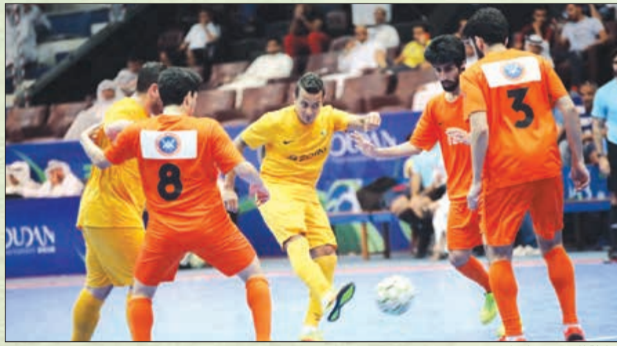
محاولة للتسديد على المرمى