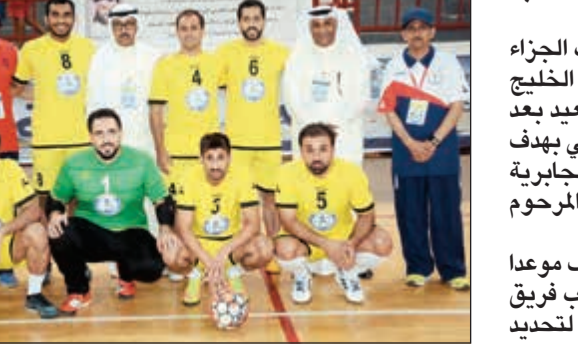
اللجنة المنظمة مع أحد الفرق المشاركة

في المباراة الأولى لم يجد فريق المصارف أي معاناة وحجز لنفسه مكاناً في الدور قبل النهائي بفوز عريض بخمسة على حساب فريق المرحوم إبراهيم البلوشي بعد مستوى كبير من لاعبي المصارف.