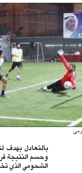
تصد رافع من حارس المرمى

بهدفين. من جهته، أشاد لاعب وسط العربي طلال نايف بمستوى الفرق المشاركة في البطولة والحضور الإعلامي الذي تحظى به الدورة قائلاً: لقد جئنا للمشاركة اليوم في النسخة الثانية من دورة النائب السابق أحمد الشحومي بناءً على السمعة التي تميزت بها في موسمها الماضي، وهو ما حفزنا إلى المشاركة في النسخة الثانية والتي صادفنا فيها فرقاً ذات مستويات فنية وتضم عناصر مميزة مما جعلنا نجتهد خلال مشاركتنا ونسعى إلى أن تستمر مشاركتنا في النسخ القادمة من البطولة.