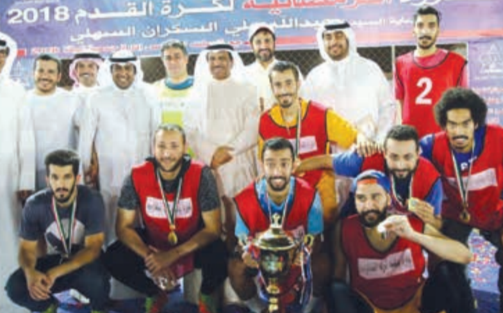
تتويج الفائز بلقب دورة جمعية الرقعة