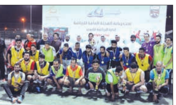
تتويج فريق المرحوم نزار النصف

رابعة الكويت تواجدت رابطة مشجعي نادي الكويت في مدرجات ملعب الشحومي لمؤازرة الفرق المشاركة في الدورة وتشجيعها ما أضفى تغييراً على أجواء البطولة التي تتميز بالحضور الجماهيري بصفة يومية.