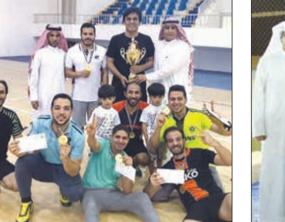
فريق جمعية الرقعة عقب الفوز ببطولة اتحاد الجمعيات

وقال الشمري: لم يتوقف دور الجمعية مع الشباب